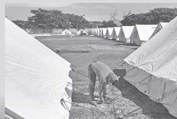
► Las casas de campa fueron donadas por empresas.