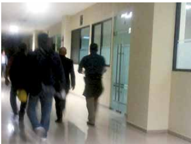
► Varias horas duró la audiencia de imputación.