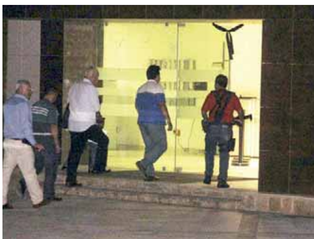
► Continúa la audiencia, tras un breve receso.