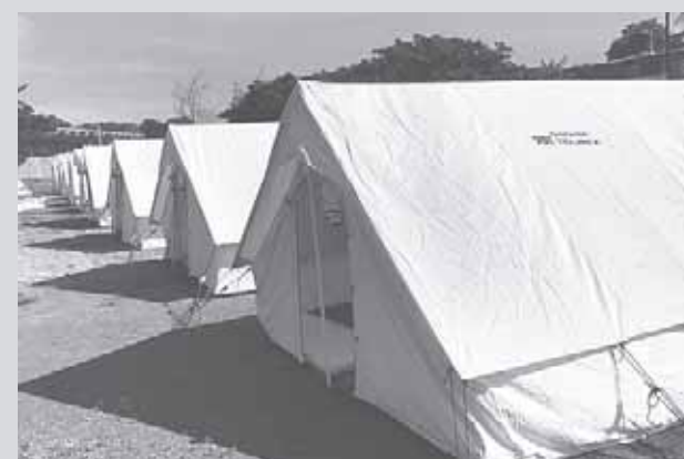
► Buscan que las familias estén libres de cualquier peligro.