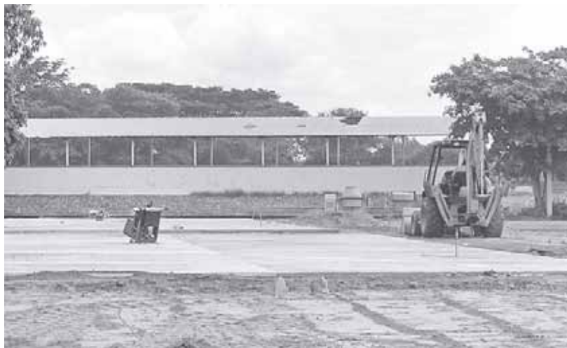
► En un campo se están montando las aulas de manera provisional.

Comentó que la ruta para la recuperación de cla-