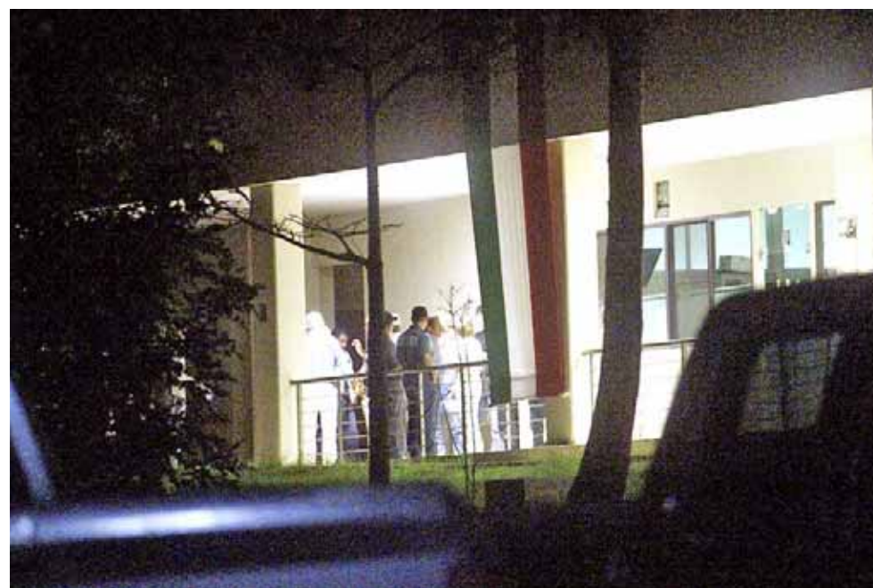
► La audiencia de imputación terminó en la madrugada.

De acuerdo con el abogado del estado, las pruebas de estos delitos, están plenamente probados, por lo