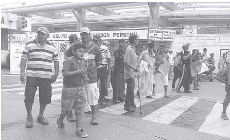
► Los pobladores serán apoyados por otros grupos de salineros.

Aseguran que si para el lunes sale el dictamen a favor de la paraestatal, bloquearán de manera indefinida la terminal marítima, ya que están cansados de los abusos