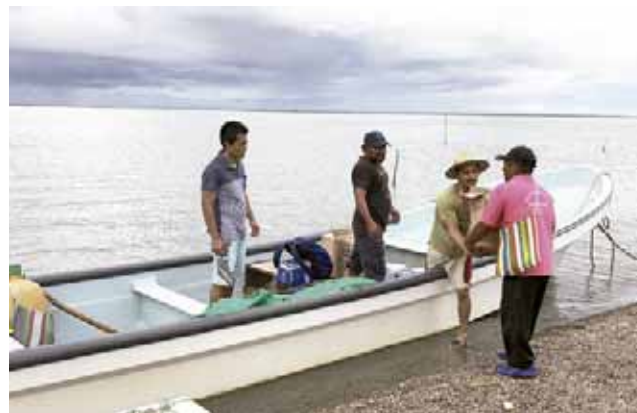
► Quieren contribuir a la reconstrucción sostenible.

no permite la utilización de la carretera, haciéndoles más complicada la vida, pues solo pueden salir y entrar por el mar, utilizando lanchas para su traslado lo cual pone en riesgo sus propias vidas.