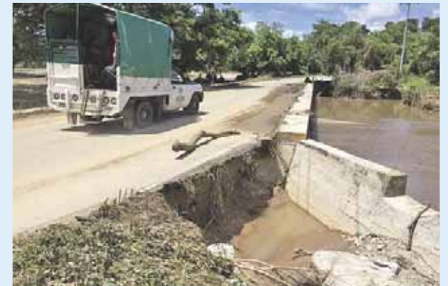
► La carretera a Pinotepa con Corralero con afectaciones.

Cabe descartar que las vías de Pinotepa Nacional a Collantes y a Corralero, se construyeron con los recursos del Fondo Nacional de Desastres (Fonden), por lo que estuvieron bajo la supervisión de la SCT.