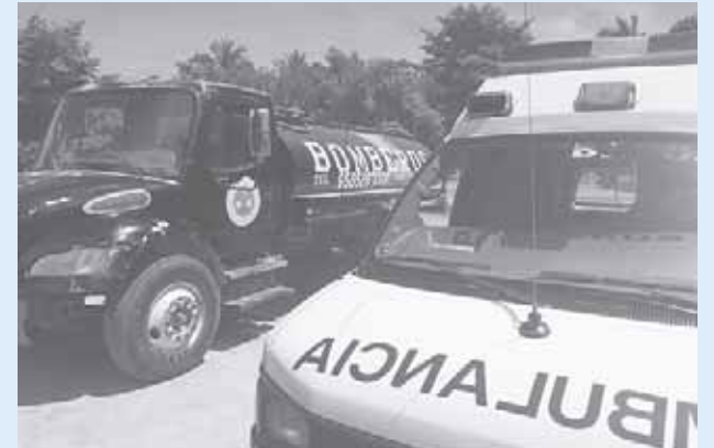
► Deuda de combustibles para la ambulancia y pipa.