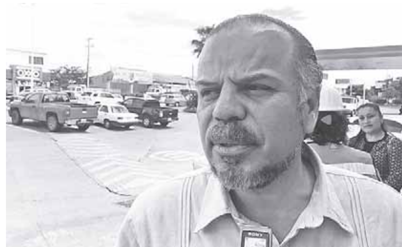
► Germán Cervantes Ayala, director General del IEEPO.