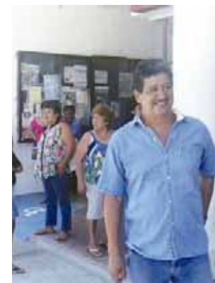
► La población, dividida.

De hecho un grupo de personas que no están de acuerdo con la administración de esa autoridad auxiliar, se manifestaron y cerraron la agencia para exigir la destitución del agen-