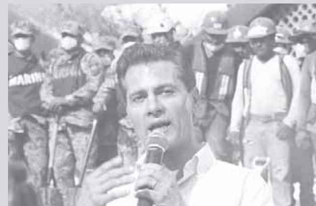
► Peña dice que las familias tendrán sus casas a fin de año.

los avances en la ayuda que se brinda a los damnificados por el sismo del 7 de septiembre, luego de que el pasado martes tuvo que suspender la visita a la entidad ante la emergencia en la Ciudad de México por el sismo de 7.1 grados que impactó severamente el corazón del país.