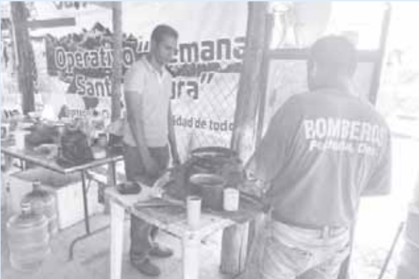
► Precaria área de cocina.