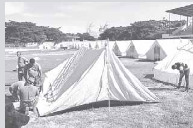
► Los efectivos de la Sedena arman las casas de campaña.

Finalmente se busca la integridad física y psicológica de las familias que perdieron todo durante el temblor del pasado 7 de septiembre.