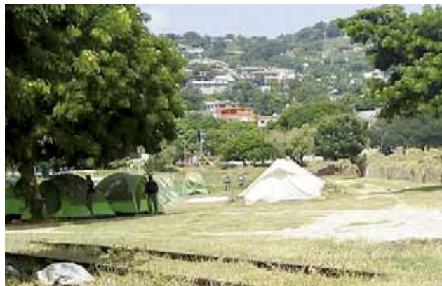
► Será utilizado como refugio.