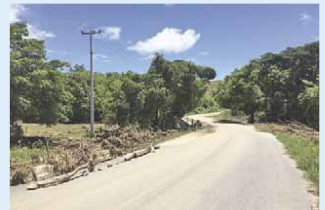
► Hacia Collantes, en el tramo carretero Cruz del Itacuan.