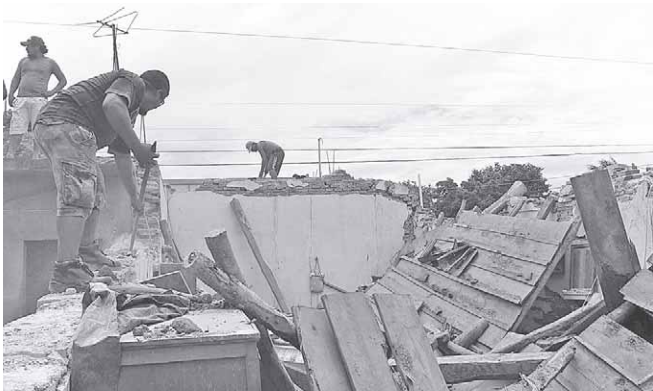
► La reconstrucción de las viviendas en la zona del Istmo ya inicia en la próxima semana; mientras los pequeñines siguen sin clases.

En Istmo y la Mixteca seguirá la suspensión de clases hasta que se tengan condiciones que permitan el regreso de los niños de manera integral: Germán Cervantes Ayala