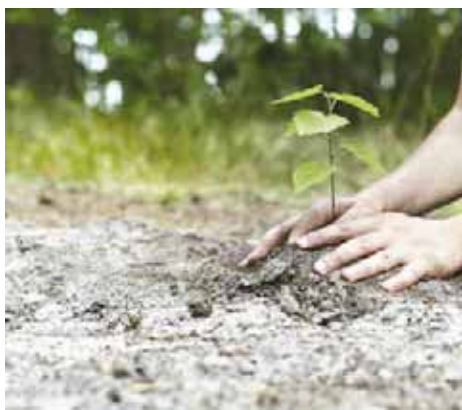
► Se tienen 700 árboles para ser sembrados en 5 kilómetros que tiene el Muro.

diente en la UNAP y después de ver lo sucedido se han visto en la tarea de ayudar a las personas de Puebla que más lo necesitan y decidieron regresar a esta ciudad de Tuxtepec para solicitar el apoyo de las familias tuxtepecanas, para que colaboren con ellos pues esta contribución es para una causa noble.