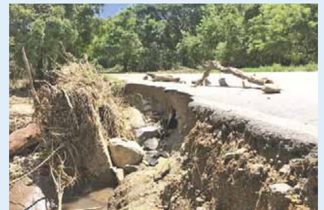
► El tramo de Guadalupe Victoria, conocido como Lagartero.