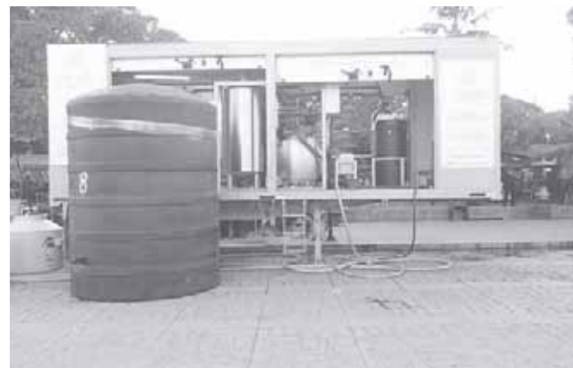
► Hay pipas de CEA, con las que se están dando el servicio.

“Hay cuatro plantas potabilizadoras de parte de Segob que son del Fonden y están ubicadas en Ferrocarril con Zaragoza, otra frente a la Iglesia del Calvario, otra frente al palacio municipal y