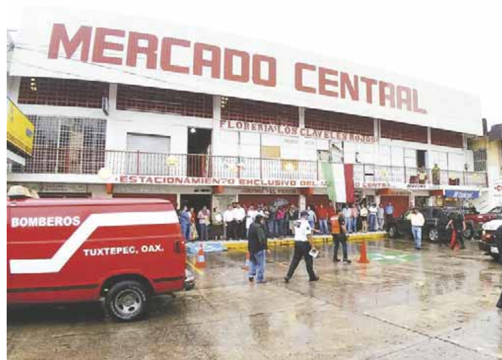
► Los mercados presentan desorganización comercial, así como fallas en sus servicios e infraestructura.