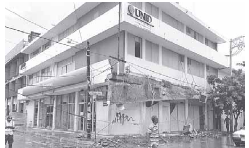
► Exhortan a los 570 ayuntamientos a crear sus direcciones de Protección Civil.