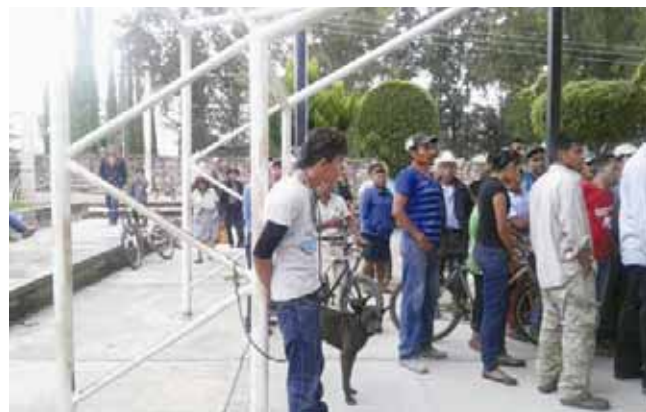
► La pronta acción de la policía logró el rescate del presunto delincuente.

Finalmente, se espera que en las próximas horas, el imputado sea presentado ante un juez, quien determinará su situación jurídica en las próximas horas.