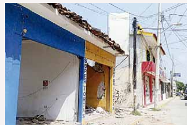
► En Juchitán, decenas de viviendas con daños desde el 7 de septiembre terminaron por colapsar.