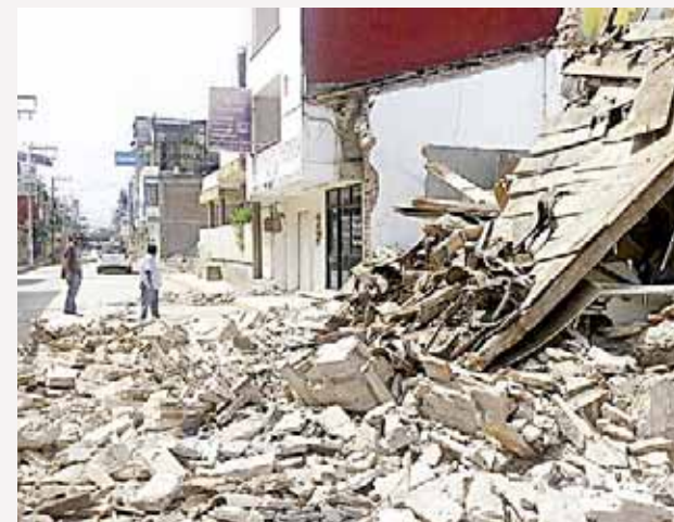
► Miles de personas se organizaron para crear albergues vecinales por el temor que sus viviendas colapsen por las réplicas.

Por la tarde, las familias del Istmo buscaban lonas ante el pronóstico de lluvias y porque pensaban dormir en las calles, parques y campos deportivos por el temor a las réplicas.