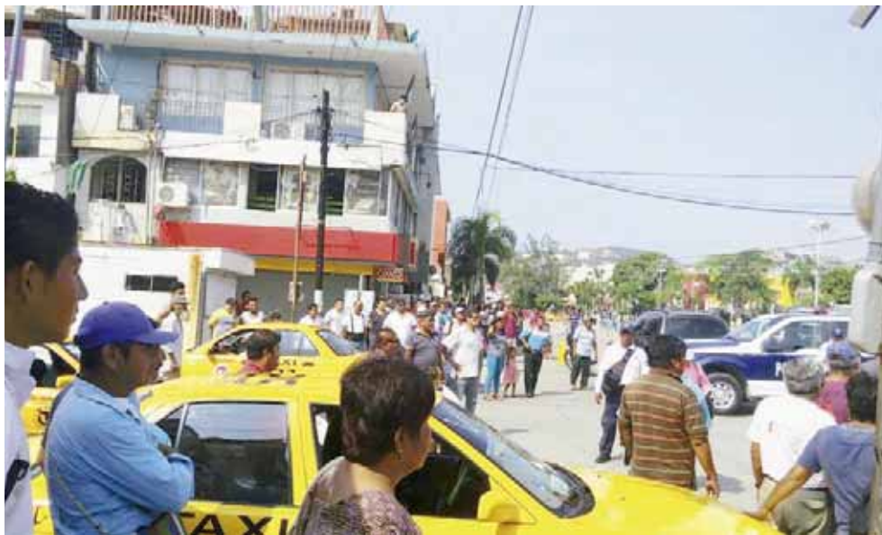
► Ciudadanos y elementos de seguridad protagonizaron el forcejeo.