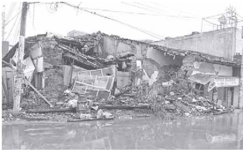
► Se deben asignar mayores recursos económicos al tema de prevención de desastres.

“El cese del anterior funcionario Amando Bohórquez Reyes no resolvió la crisis que se vive en el Istmo de Tehuantepec y mucho menos atendió la falta de bocinas de alertamiento en la capital y municipios conurbados, al operar a su mínima capacidad, pese a