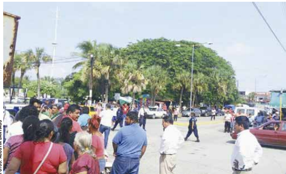
► Se generó una batalla campal donde hubo intercambio de golpes y patadas.