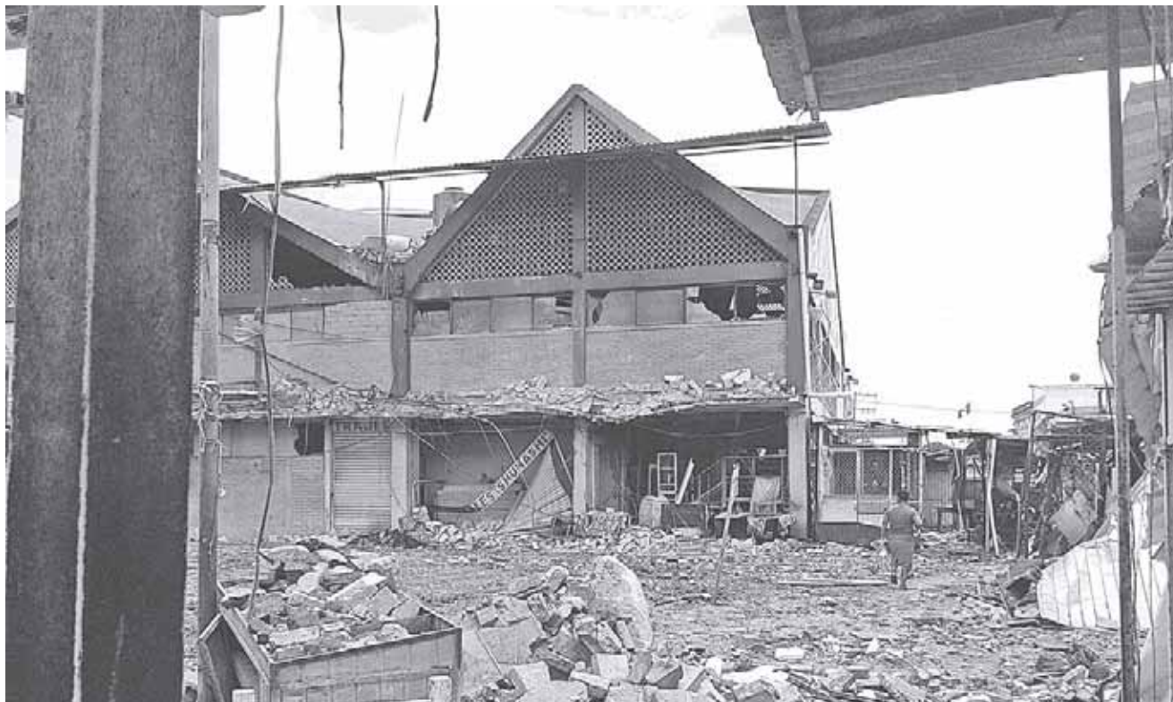
► El Atlas de Riesgo de Oaxaca no ha sido actualizado desde hace 7 años.

Urge destinar mayor presupuesto a la capacitación y creación de direcciones de PC en los 570 municipios, opina Horacio Antonio