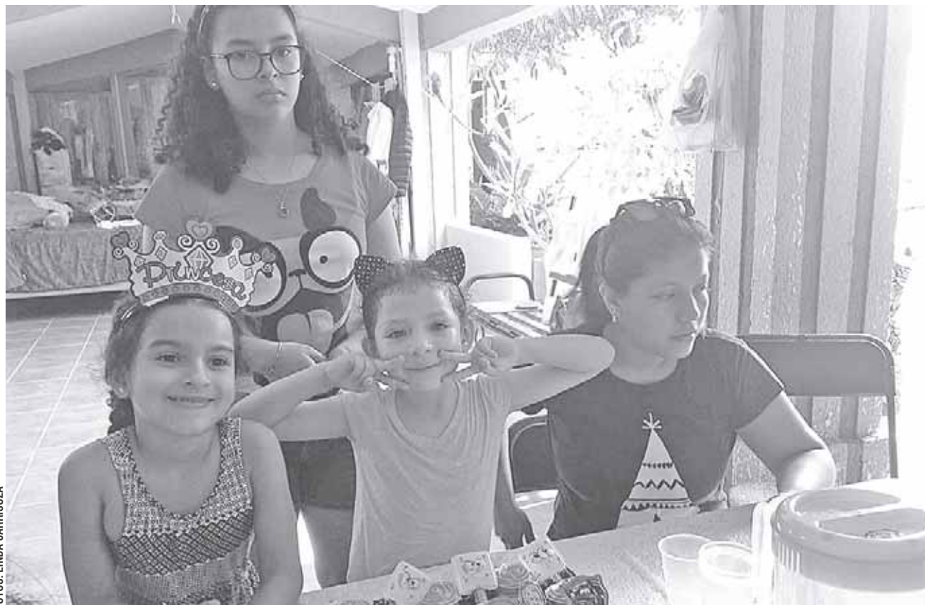
► La cumpleañera fue agasajada en su hogar.