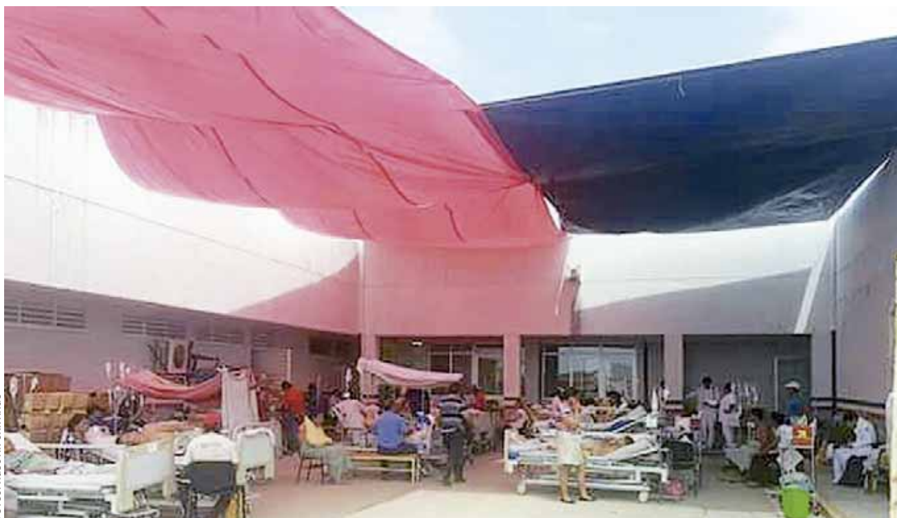
► A las 08:30 horas un contingente de empleados, médicos, enfermeras y camioneros desalojaron a los ciudadanos hospitalizados.

Directivos de la institución médica y autoridades de Protección Civil determinaron poner a salvo a los enfermos al personal y llevarlos al patio del nosocomio