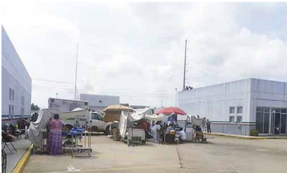
► Los gritos de desesperación, angustia y llanto entre los pacientes y familiares era incesantes.