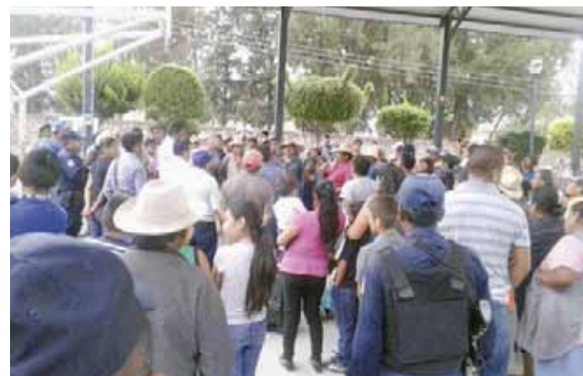
► Lo encontraron en posesión de un lote de joyas, dinero en efectivo y una pantalla.