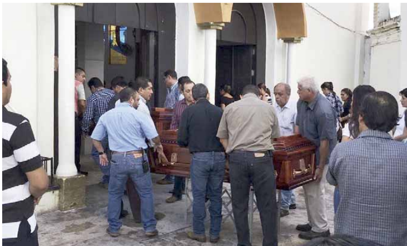
► Durante el día de ayer, fueron velados en el domicilio donde pasaron su niñez.

Además, los congregados durante el sepelio elevaron una oración para pedir por las víctimas y los heridos, entre los cuales se encuentra un familiar más de los fallecidos, quien está hospitalizado en la Ciudad de México.