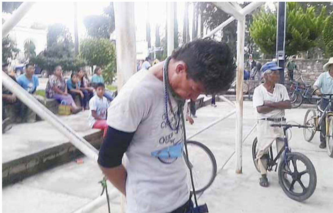
► El hombre fue capturado por vecinos y entregado a elementos de la Policía Municipal.