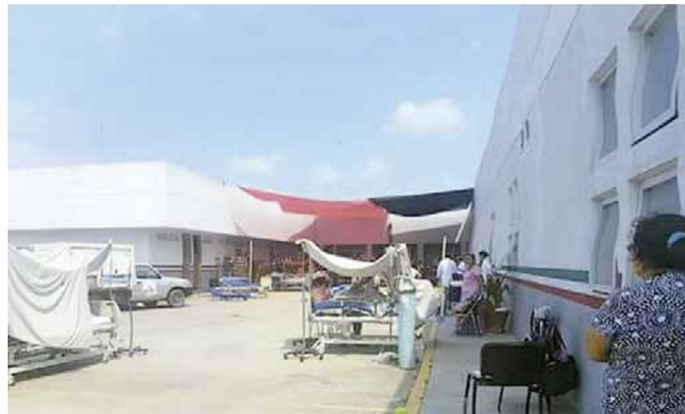
► Los médicos pidieron medicamentos, agua, suero y equipos quirúrgicos para los pacientes.