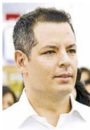
► ALEJANDRO MURAT HINOJOSA

Como si no hubieran sido suficientes los latigazos con los que las lluvias intensas nos fustigaron durante los últimos meses, y el sismo de magnitud 8.2 que devastó parte del estado, principalmente la zona del Istmo de Tehuantepec, el pasado martes otro siniestro, éste de magnitud 7.1, con epicentro