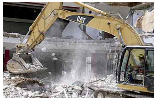
► Exhortan a emplear el fondo estatal de protección civil para reconstrucción de las comunidades.

En 2009 México fue el primer país en utilizar el programa MultiCat del Banco Mundial, el cual proporciona asesoría técnica a los países en el diseño y emisión de bonos catastróficos con cobertura para múltiples amenazas y