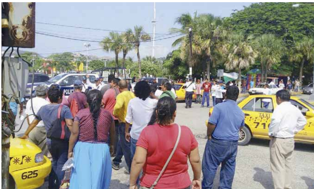
► Los ciudadanos alegaron abuso de autoridad por parte de los oficiales de la Policía Vial.

Todo comenzó cuando un elemento de la Policía Vial intentó multar a un taxista estacionado en doble fila sobre 5 de Mayo