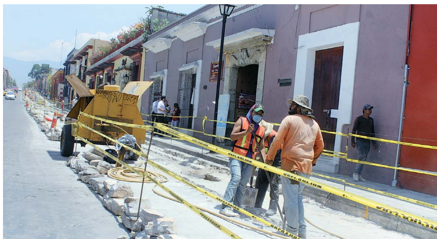
► Algunas de las obras que se han realizado en el centro de la ciudad.