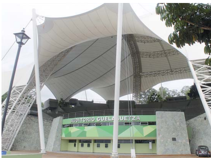
► El auditorio los recibió durante tres días.

capital@imparcialenlinea.com / Teléfono 501 83 00 Ext. 3174