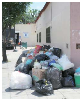
► La basura se acumula en las calles de la ciudad.