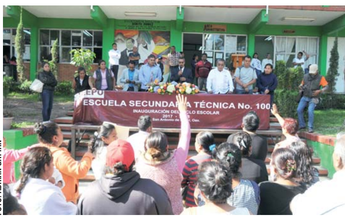
► En San Antonio de la Cal, maestros de la Sección 22 desconocieron al director de la EST 100; los padres de familia salieron en defensa del directivo.