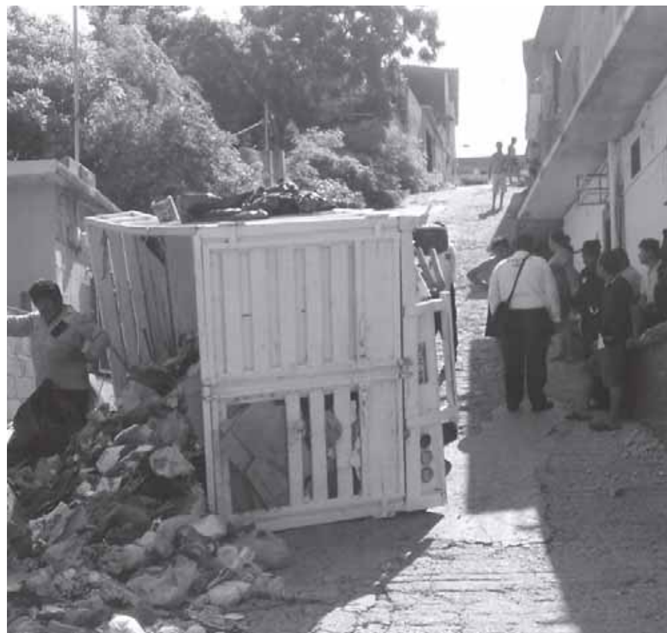
► La unidad fue puesta en su sitio con ayuda de una grúa.

Afortunadamente en este accidente vial no se registró pérdidas humanas que lamentar sólo cuantiosos daños materiales valuados a varios miles de pesos.