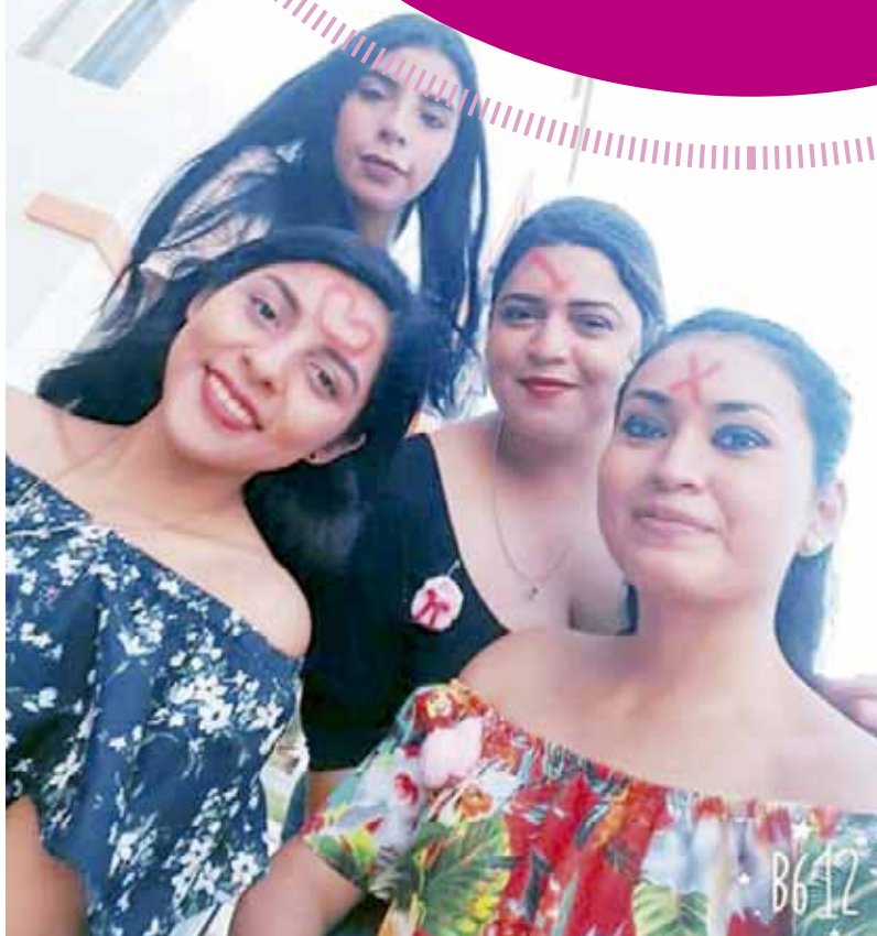
► Las amigas de la futura mamá.

El festejo se realizó en su domicilio particular de Pishishi, desde este espacio le deseamos lo mejor en esta etapa de sus vidas.