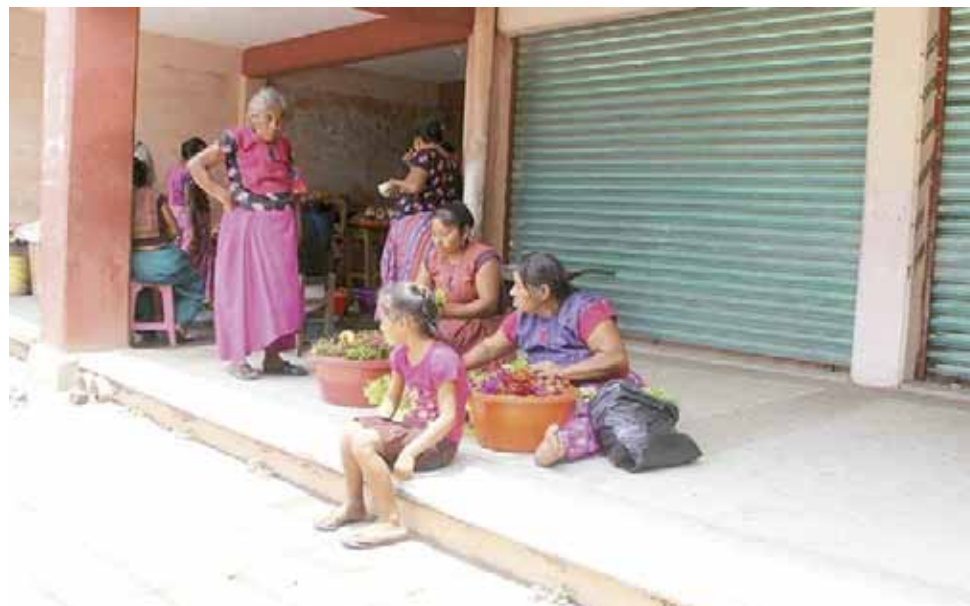
► A las afueras del mercado, las comerciantes se mostraron más seguras por la designación de los guardias.