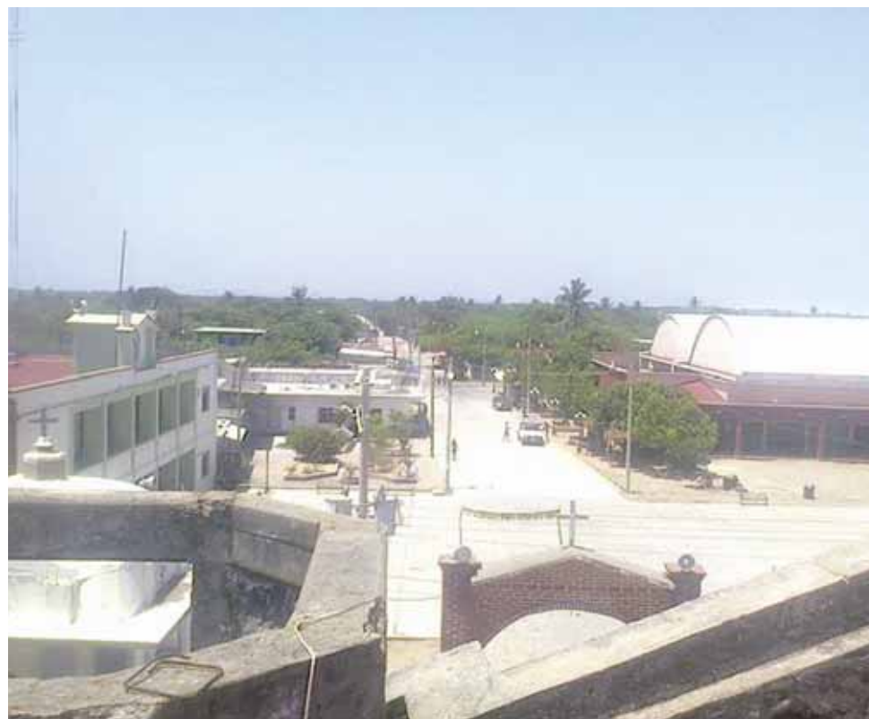
► Los habitantes de la zona ya se sienten más seguros porque hay colonos que ya realizan funciones de seguridad pública.

Esto añadió ha sido porque su pueblo carece de una figura pública que ponga orden, por lo que urgió la integración de un cuerpo municipal para devolverle la tranquilidad a los huaves.