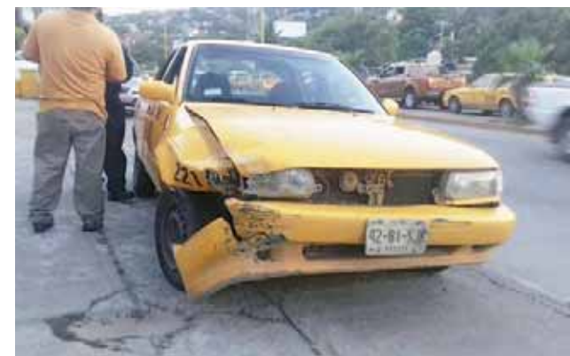
► La unidad de transporte público quedó con el cofre averiado tras la colisión múltiple.