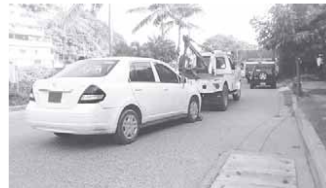
► La unidad fue trasladada al corralón de la ciudad.

Los uniformados temían que el conductor del auto compacto causara algún accidente por el estado de ebriedad en que se encon-