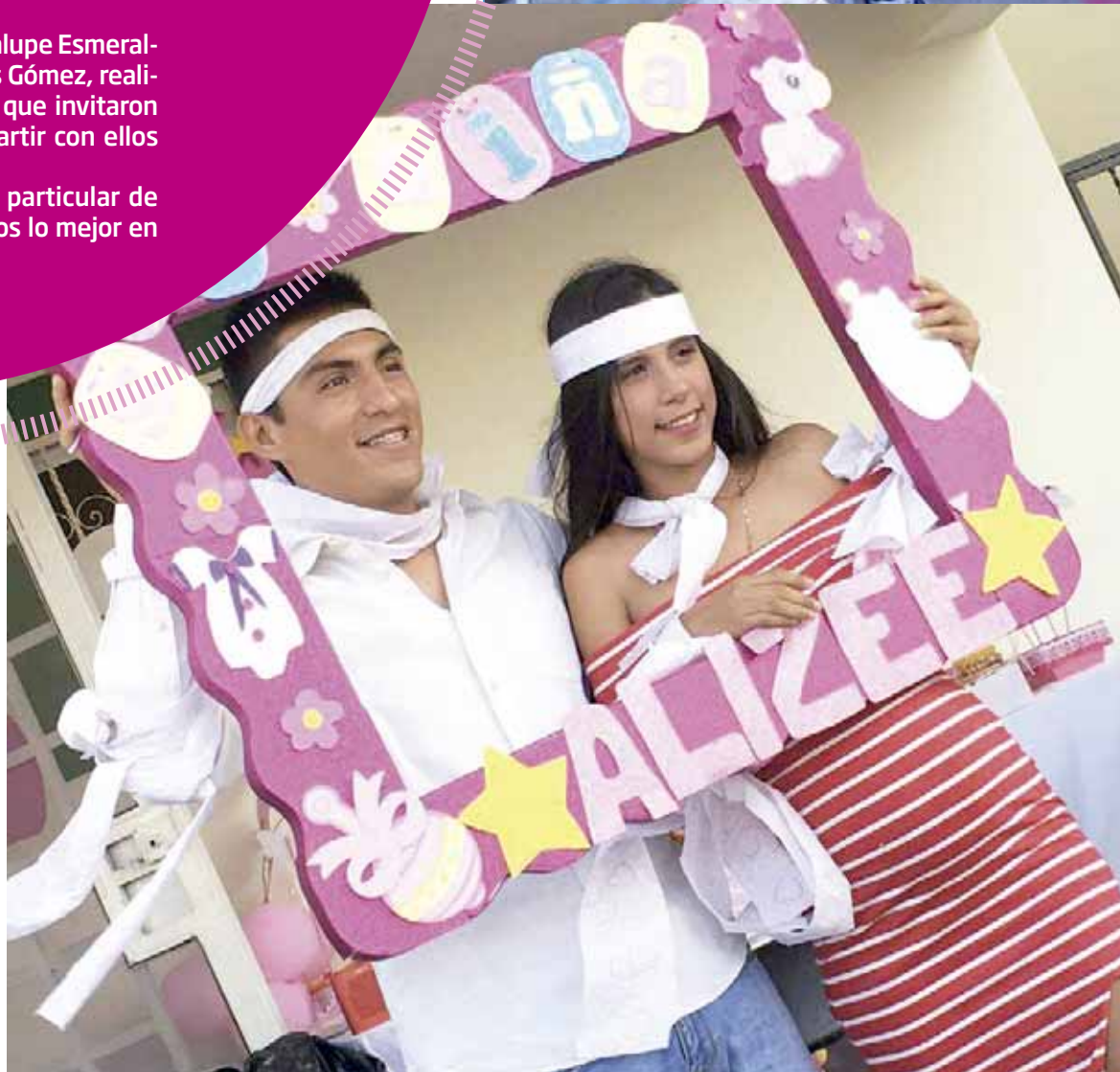
► Los futuros padres posaron para la foto del recuerdo.