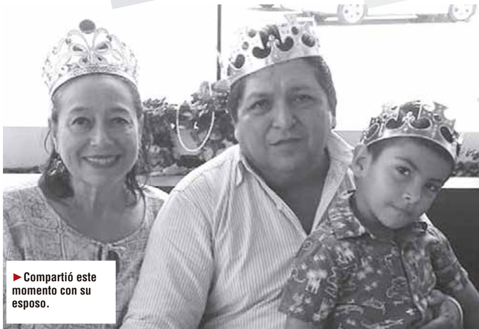
► Compartió este momento con su esposo.