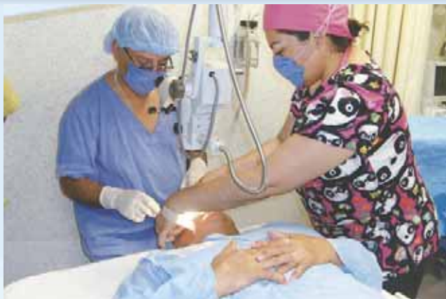
► A los pacientes que requieren de una atención especial son mandados a hospitales especializados y fuera de la ciudad.

tamente se construirá en la ciudad pues con anterioridad el gobierno estatal colocó la primera piedra pero aún no hay nada en concreto.