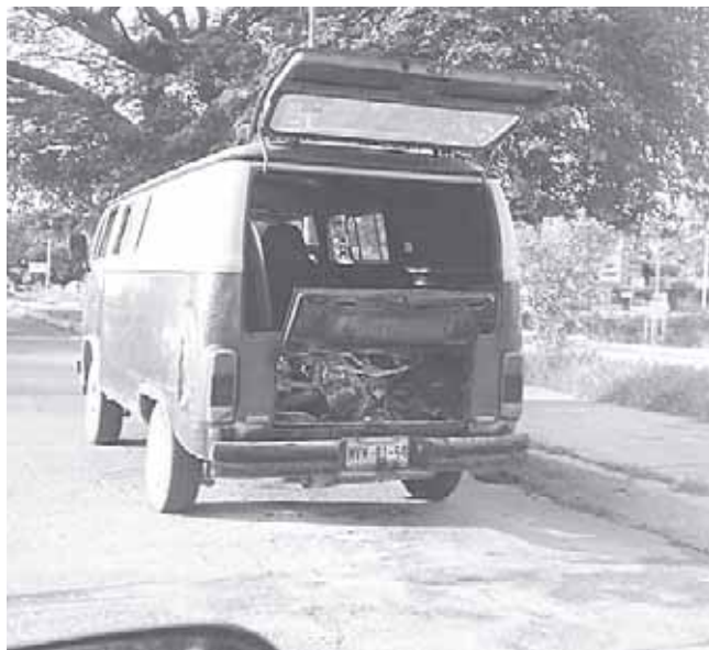
► Oportuna reacción de los bomberos de Protección Civil.