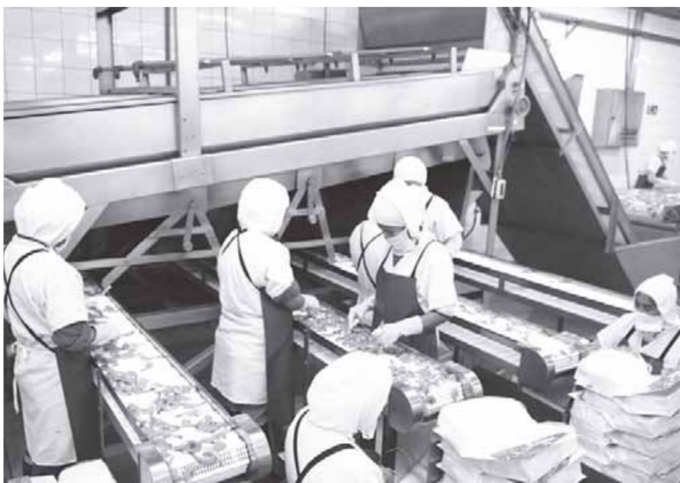
► El rango de edad abarca de los 18 a los 40 años de edad.

Dijo que para cualquier información están ubicados en la avenida Tampico de la colonia Centro en donde se ubican las oficinas del Movimiento Nacional por la Esperanza.