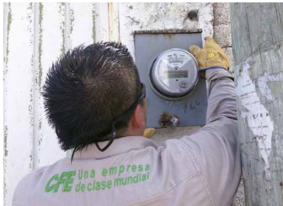
► Señalan que se ha tratado de regularizar principalmente los contratos de energía eléctrica de los pozos de agua.

Hasta el momento se han tenido aproximadamente siete reuniones con CFE, quienes han tenido la voluntad de brindar el apoyo necesario a la ciudadanía Tuxtepecana como de las comunidades aledañas, es por eso que hacen la invitación para que marquen el 071 si tienen problemas eléctricos.