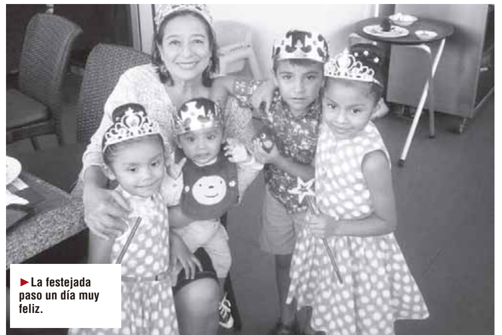
► La festejada paso un día muy feliz.