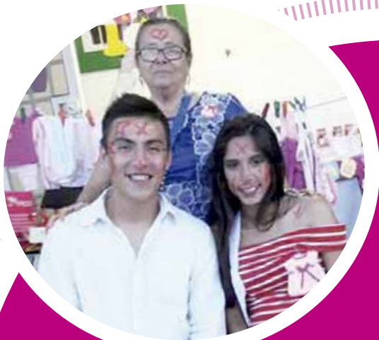
► Muy contentos esperando a su nena.