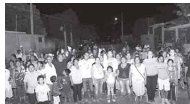
► La presidenta municipal de Tehuantepec anunció la remodelación del Centro Histórico.

López Portillo corresponden a la cuarta y quinta acción culminada e inaugurada durante este periodo municipal; "Así poco a poco iremos inaugurando la pavimentación de calles, ampliaciones de energía eléctrica, los domos y canchas, entre otras que fueron priorizadas por ustedes los ciudadanos", añadió la fuente.