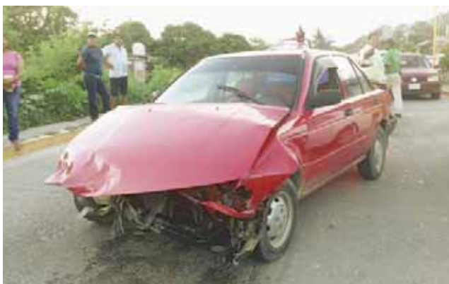
► El tercer auto que quedó con severos daños materiales tras el accidente.