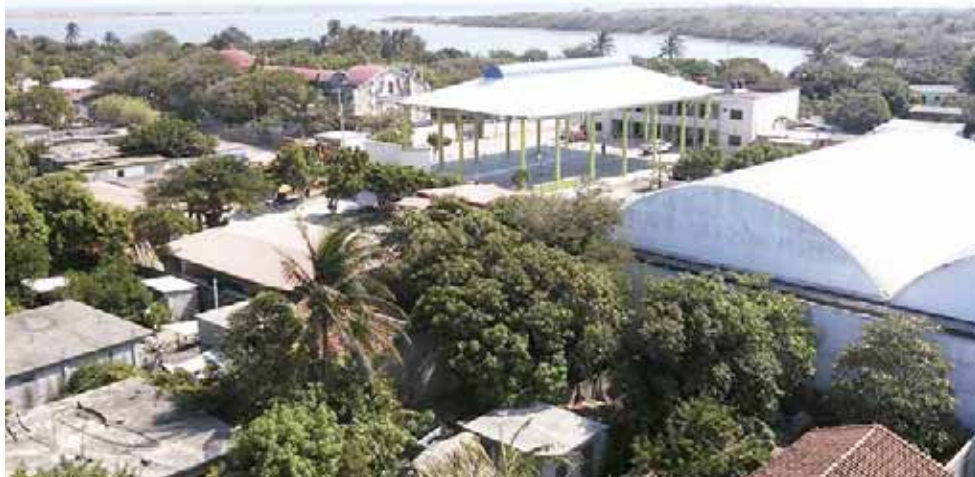
► En San Mateo del Mar la mayoría de su población se dedica a la pesca y asimismo a la venta del producto del mar.