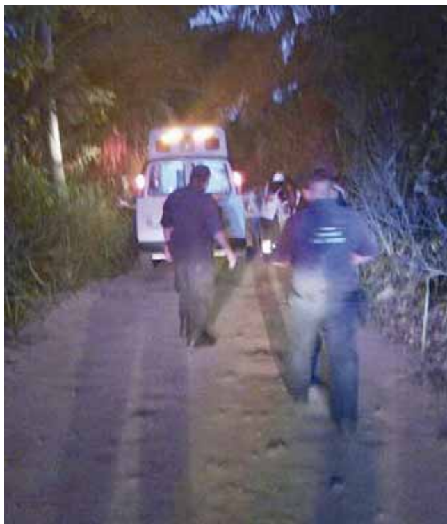
► El hecho sucedió en la carretera de terracería que va hacia Ventanilla.

De inmediato algunas personas quienes se percataron de lo ocurrido, dieron aviso a las oficinas del servicio de emergencias 911, de donde fue enviado el auxilio por parte de los operadores del servicio, quienes hicieron llegar al lugar a elementos de la Secretaría de Seguridad Pública, Tránsito del Estado y personal de la Cruz Roja Mexicana, quienes atendieron al lesionado, quien fue trasladado de emergencias con destino a una clínica particular de esta ciudad.