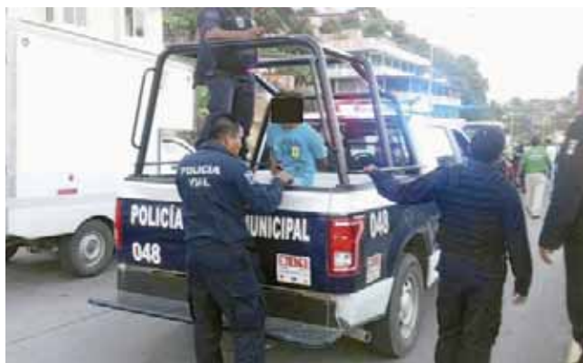
► El conductor del taxi que presumiblemente provocó el accidente fue arrestado.

al corralón correspondiente por medio de una grúa en lo que se deslinde responsabilidades.