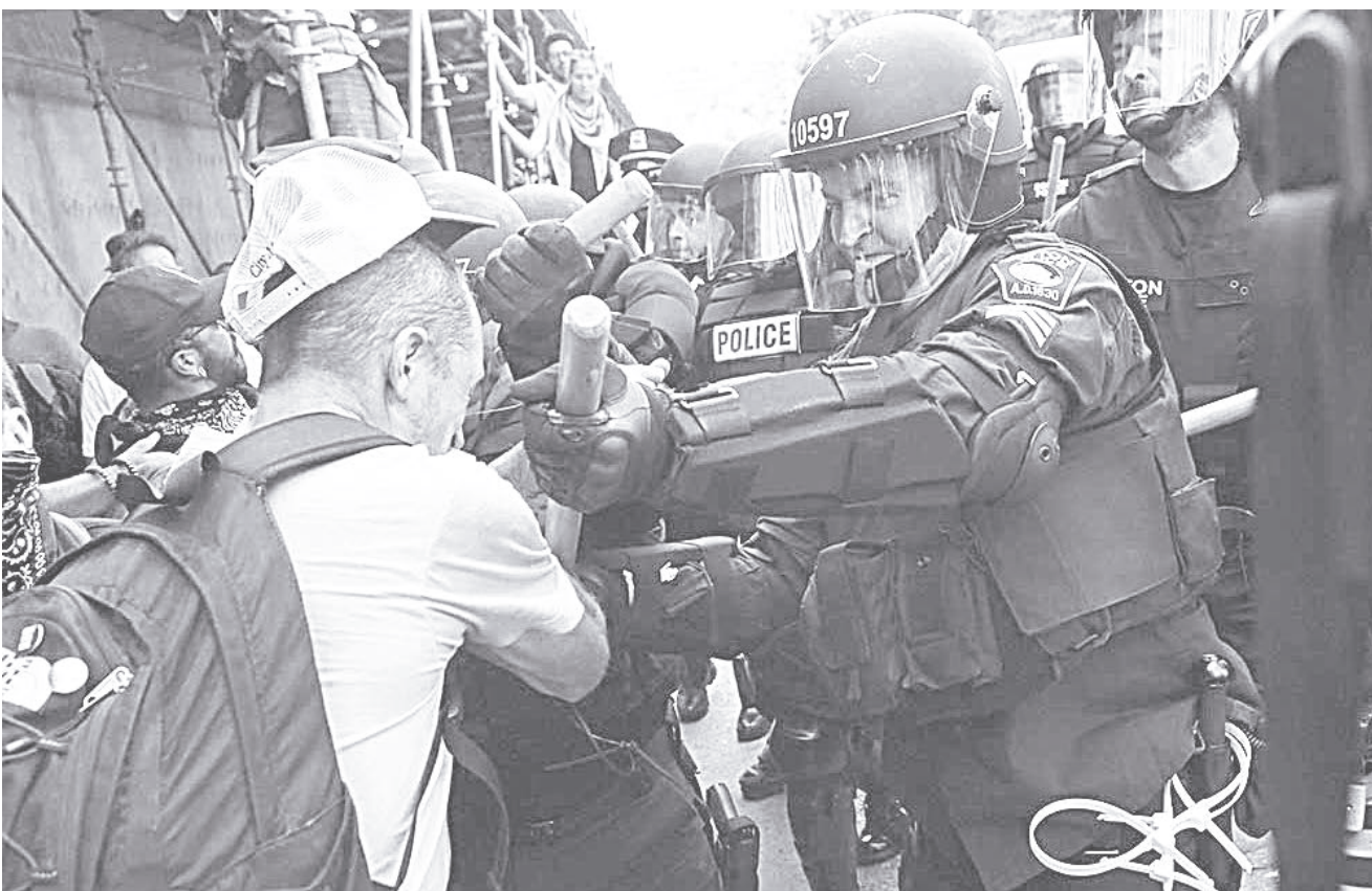
► Un miembro de la policía impide que un manifestante cruce la línea.

A pesar de que la policía mantuvo a distancia a ambos bandos, se registran algunos episodios violentos durante las movilizaciones