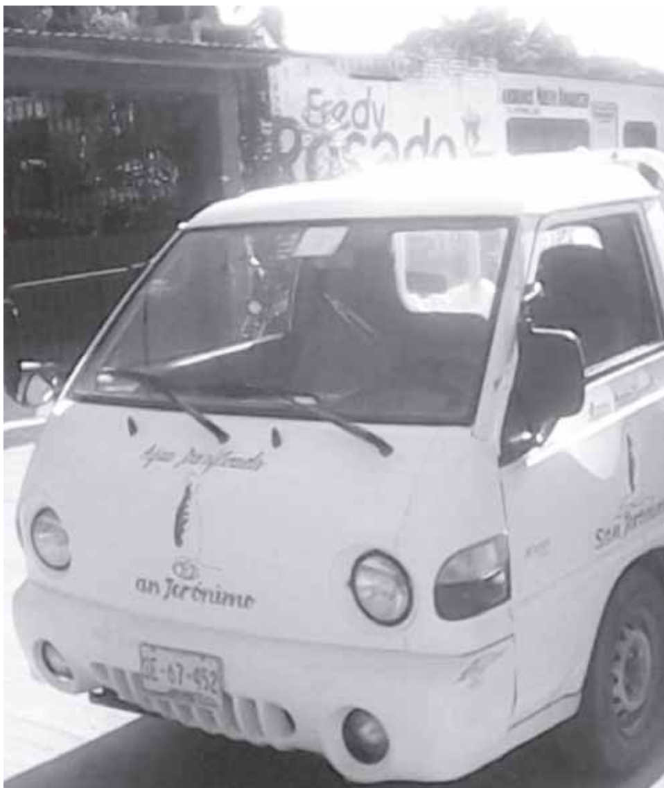
► La unidad que resultó con daños.