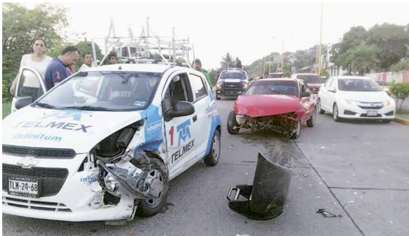
► El fuerte golpe se escuchó varios metros del lugar del accidente, lo que alertó a las autoridades.

Minutos más tarde, el conductor fue detenido por la Policía Municipal, su aspecto y actitudes reflejan que consumió bebidas embriagantes, como responsable del accidente deberá pagar una cuantiosa multa y pasar unas horas en las frías celdas de la cor-