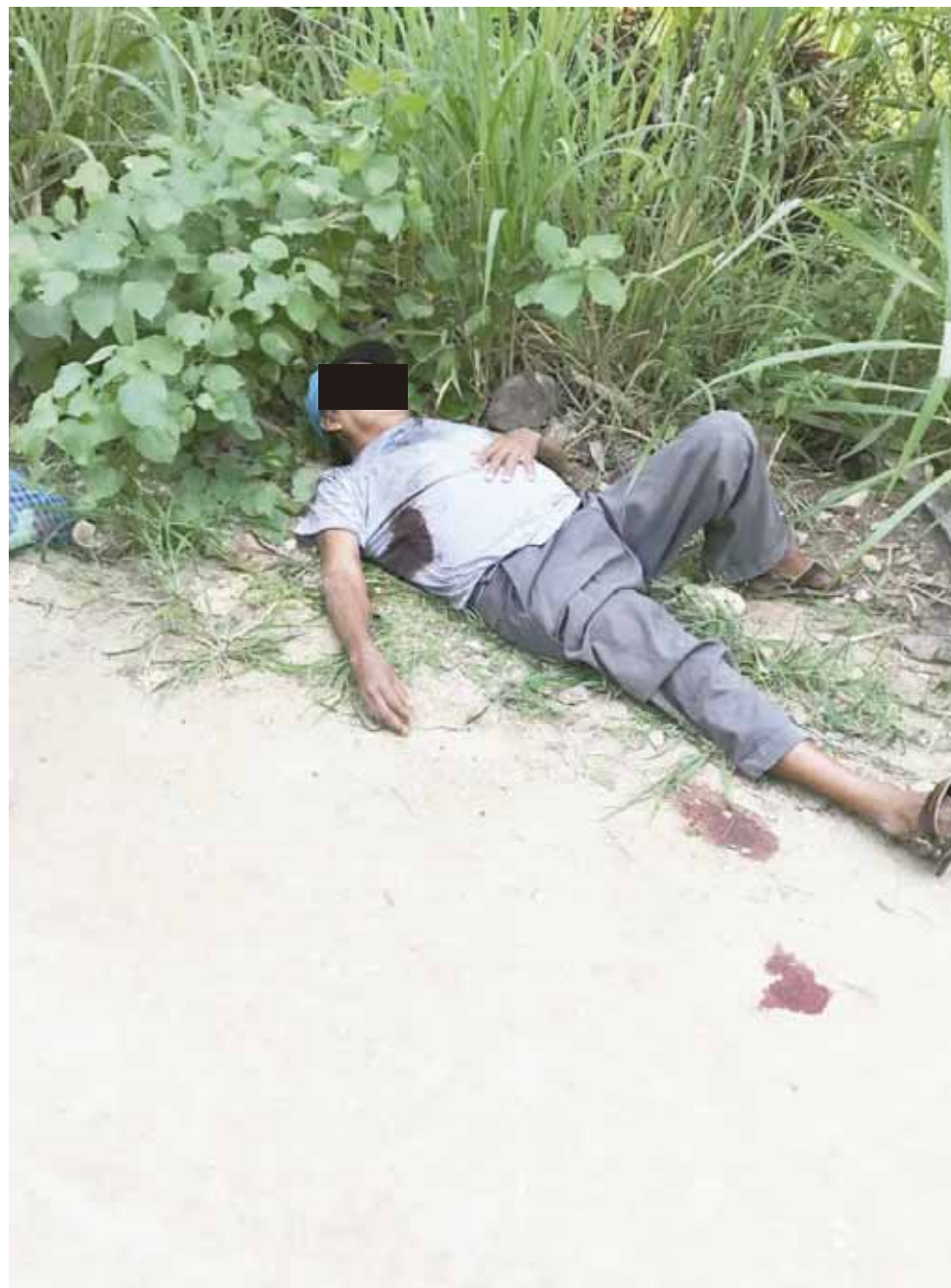
► Las primeras líneas de investigación apuntan a que el atentado podría estar ligado a un posible ajuste de cuentas.

A dicho homicidio, se le asignó una carpeta de investigación por el delito de homicidio calificado en contra de quien o quienes resulten responsables.