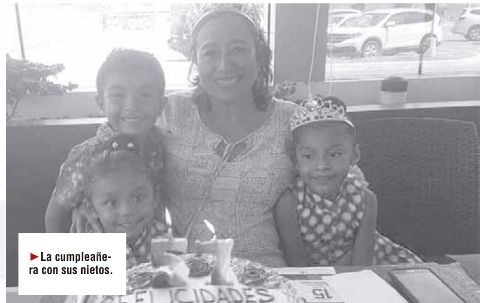
► La cumpleaños con sus nietos.