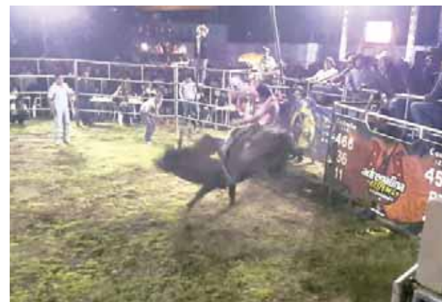
► Los jaripeos, entre lo más esperado de la feria.

Las noches de discoteca no serán la excepción y los toros mecánicos, así mismo los jaripeos con jinetes reconocidos, el palo encendido entre otros eventos que fueron preparados para que la celebración de Santa Rosa de Lima sea