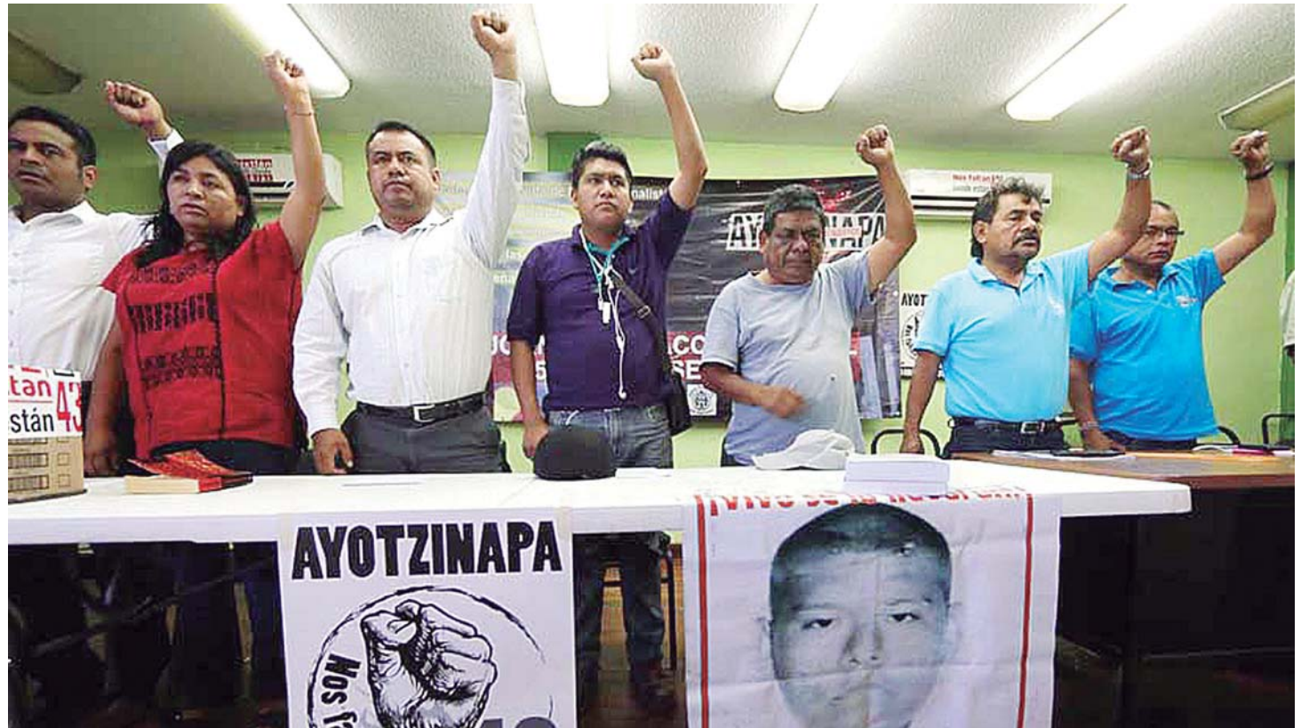
► Desde hace mucho, el Movimiento Democrático de los Trabajadores de la Educación de Oaxaca (MDTEO) hizo agua. Arrastra un lastre muy pesado: el repudio social

EN 2000 tuvimos alternancia e igualmente en 2012 cuando el PRI regresó a Los Pinos pero gobernando sólo 16 entidades. Carro incompleto. Pero en su reciente Asamblea, el PRI de Peña y "Clavi" Ochoa ofrecen "Carro Completo" para 2018, precisamente en un entorno político más complicado a que se haya enfrentado: el avance del populismo de Morena y su dictatorial mesías, las brutales corruptelas de sus gobernadores, la ineficacia del gabinete presidencial y la falta de cuadros (tuvieron que abrir los candados para buscar un candidato no priista). Todo eso presagia no sólo un carro incompleto, sino una carcatina desvencijada que necesitará respiración artificial para su sobrevivencia.