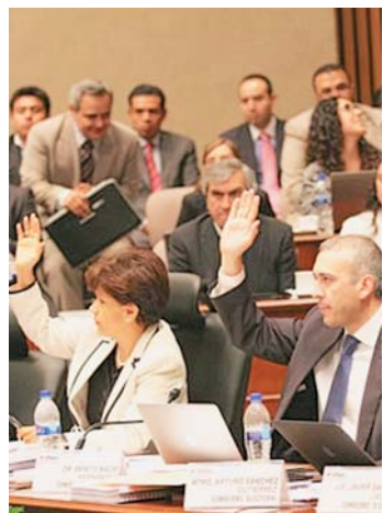
Seis mil 788 millones de pesos, es el más alto en la historia.

Los Alebrijes empataron ante Dorados y siguen invictos en Liga y se mantienen sublíderes. 1C