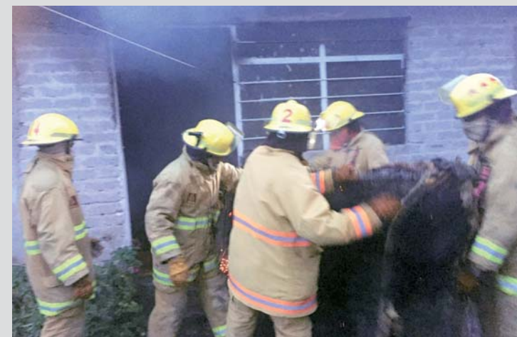
► Los muebles quedaron calcinados.

llamas se expandieran a otras viviendas, pues la mayoría de las familias tienen su tanque de gas LP en sus patios.