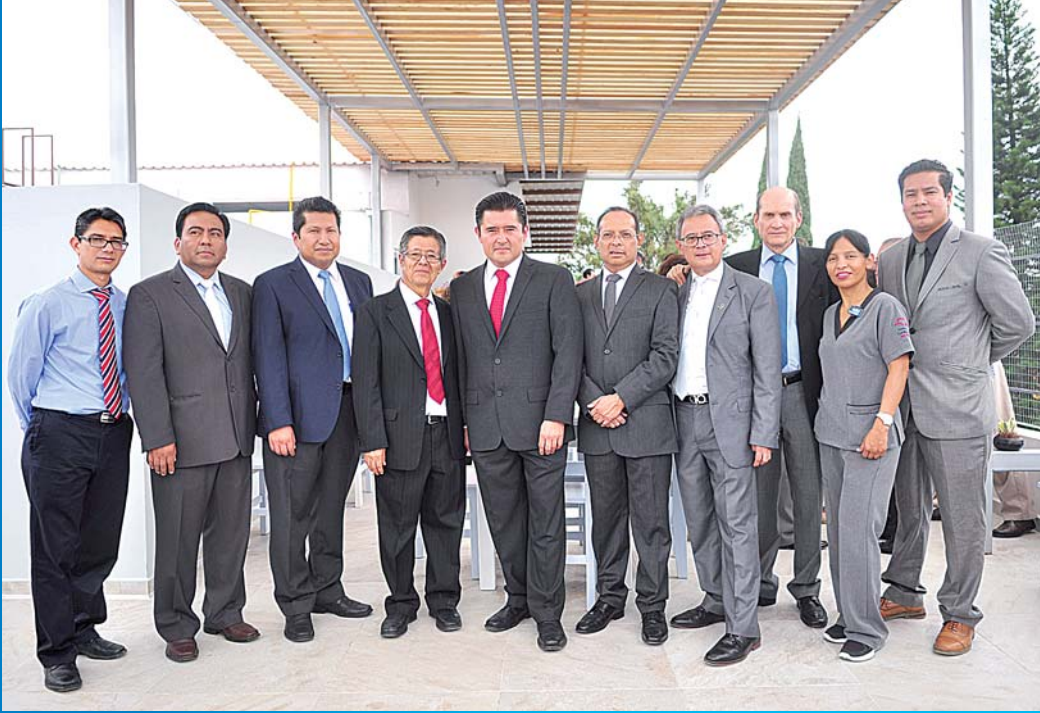
► Equipo médico del Hospital Cardiológico.

estilo@imparcialenlinea.com / Teléfono 501 83 00 Ext. 3171