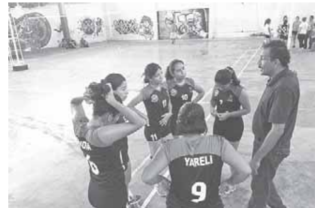
► Panteras no da marcha atrás.