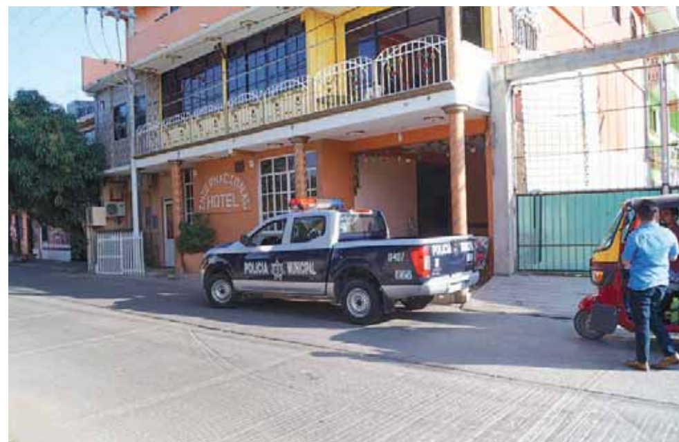
► Pese a que la policía acudió al llamado, ya no pudieron dar con los delincuentes.

Cabe señalar que la zona centro se ha visto más vulnerable recientemente a los asaltos, porque señalan alta presencia de mototaxistas, quienes tienen sus bases cerca de las zonas afectadas, pues se presume que estos colaboran para que los asaltos puedan ser perpetrados teniendo un gran éxito en la huida de los asaltantes.