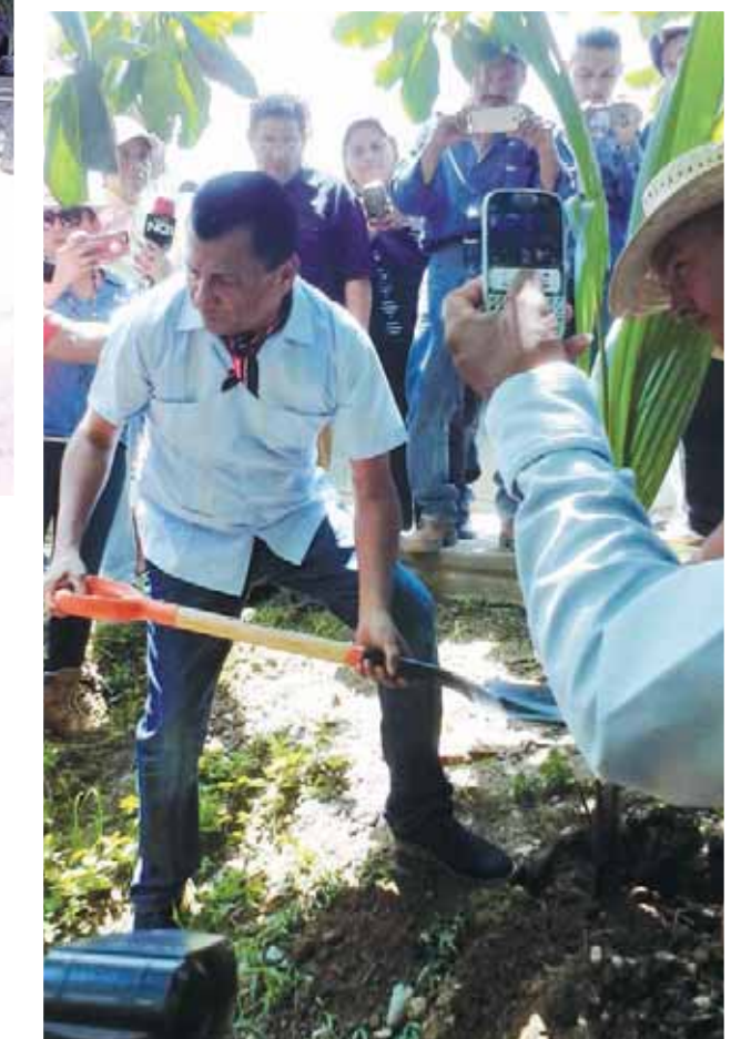
► Durante la plantación de las palmeras.