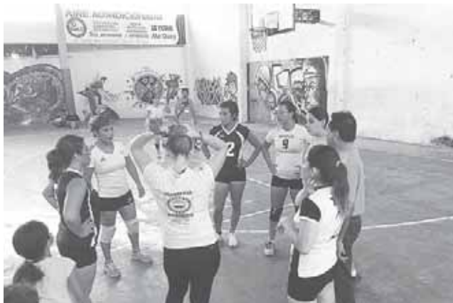
► Buscando estrategias las Spartanas.