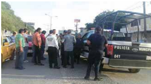
► El hecho causó la movilización policiaca.

Afortunadamente durante el percance no se registró pérdidas humanas, sólo daños materiales cuantificados en varios miles de pesos