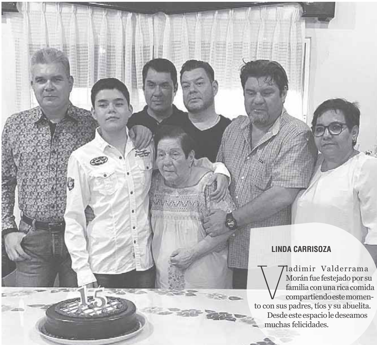
► El festejado en compañía de sus tíos y abuelita.