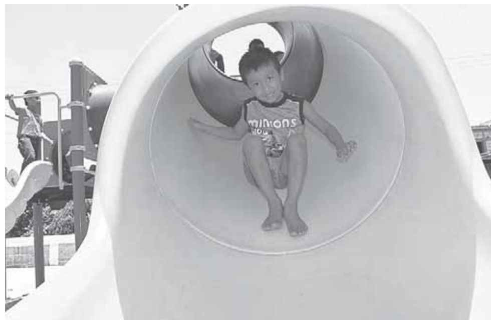
► Los pequeños de las distintas colonias ya tienen un área para recrearse.