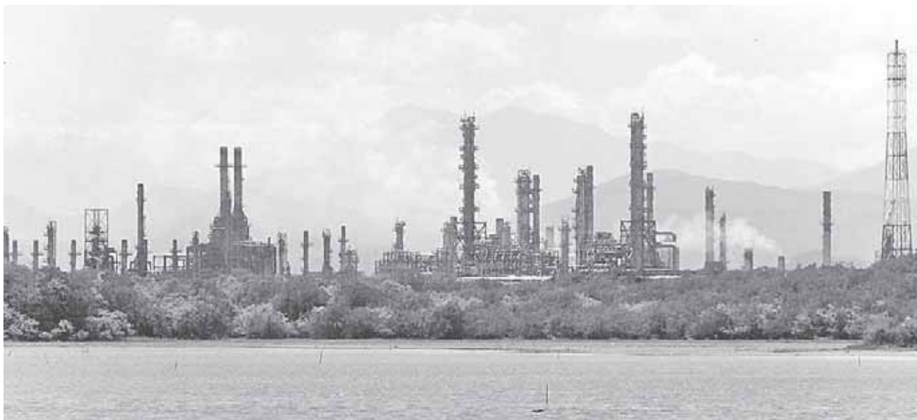
► Luego de los trabajos y las pruebas de arranque, ya opera con normalidad.

A finales de julio, Pemex inició con las pruebas para poner de nuevo en operación a la refinera. En la primera semana de julio la refinera reanudó los trabajos