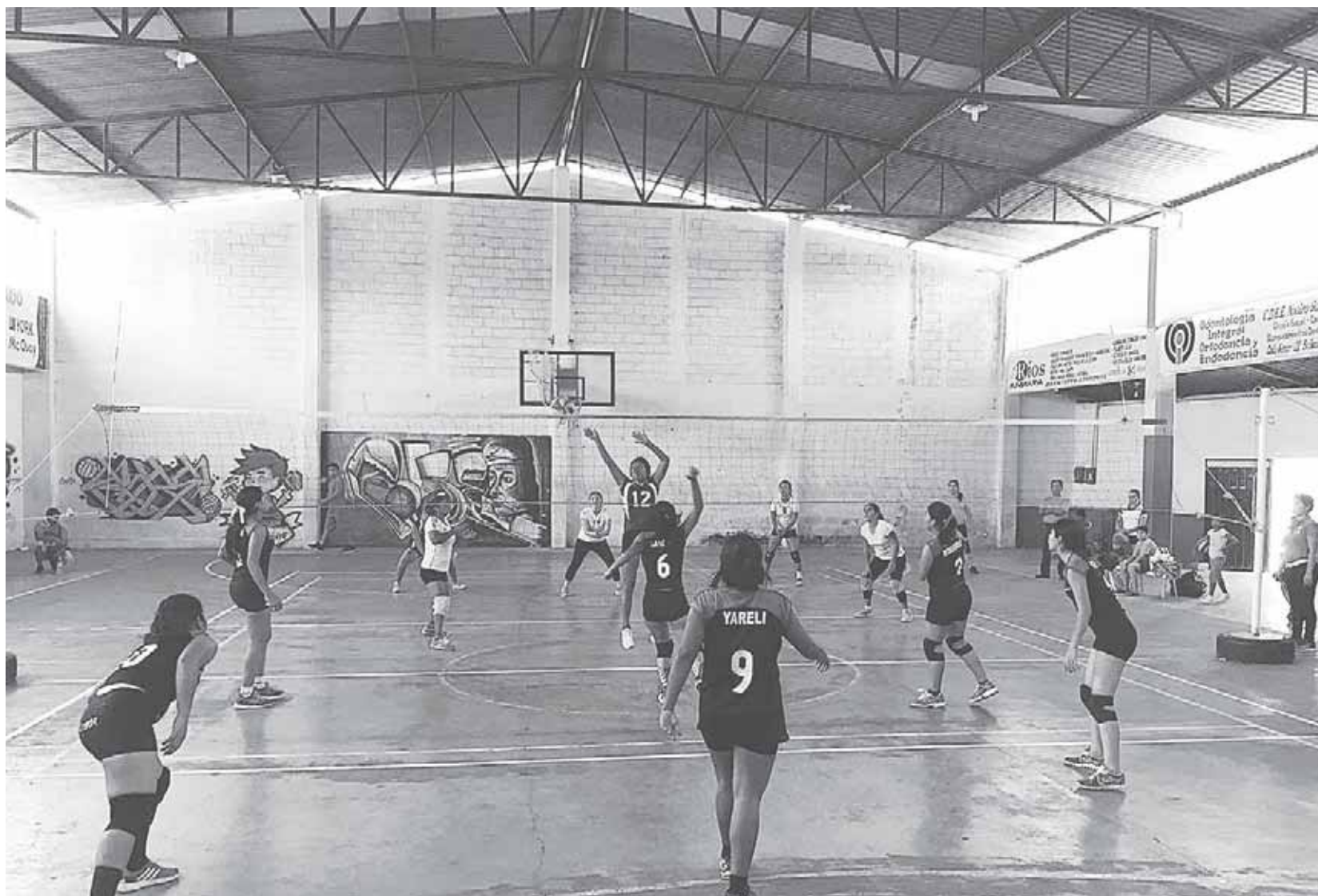
► El partido, muy cerrado.

Para el segundo parcial, las jóvenes de Spartanas dieron una férrea pelea con las líderes y empezaron a responder de manera sorpresiva sobre sus adversarias logrando emparejar las acciones en la duela de juego y fueron anotando sin dejar avanzar a las Panteras, para que en la recta final del episodio les ganaran la delantera y