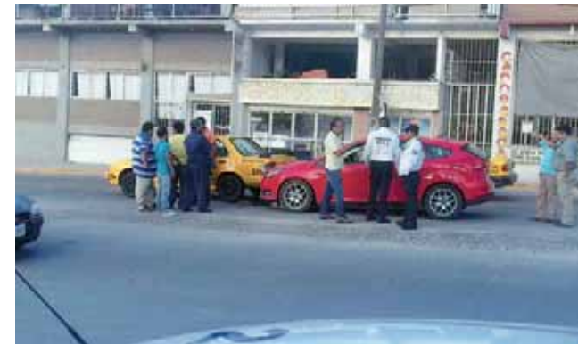
► Del accidente no se reportaron heridos de gravedad.

Sujetos armados se apoderan de la cuenta del día y logran darse a la fuga con rumbo desconocido