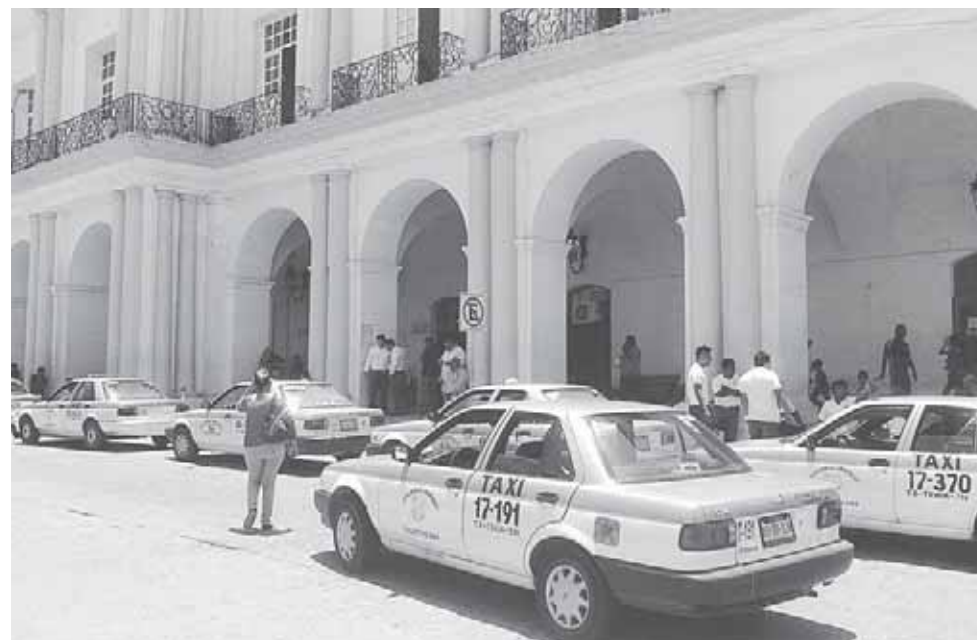
► El grupo de ruleteros inconformes estuvieron un breve tiempo en el lugar.

Luego de una hora de manifestarse, los taxistas se retiraron del lugar y despejaron esa arteria tan importante para evitar que se continuara afectando.