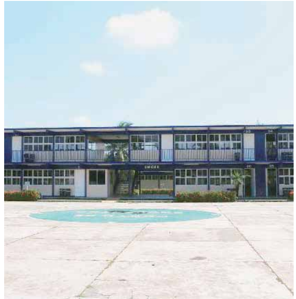
► Personal docente exige salida de directora y subdirectora.

Mencionó que el alumnado sabe de esta problemática, así como los padres de familia, a quienes se les hizo llegar un documento el semestre pasado y esta ocasión también se les avisó por medio del comité de padres de familia siendo principal-