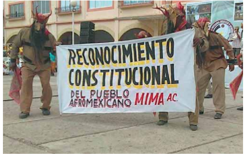
► Aseguran que ya están cansados de la apatía de los gobiernos, municipal, estatal y federal.