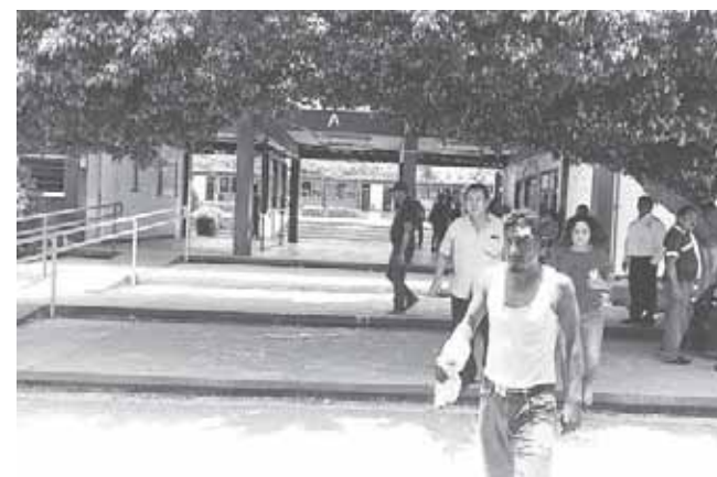
► Uno de los heridos, tras la trifulca.

Dijo que la contratación de maestros evaluados pasa a depender del servicio profesional docen-