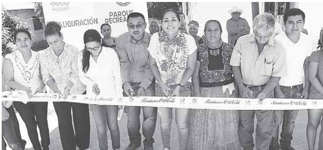
► El objetivo es que los pequeños tengan un espacio de esparcimiento cerca de su localidad.

Fraccionamiento Villa del Sol, Morro Mazatán y San Isidro Pishishi tienen espacios dignos para deleite de los niños y niñas