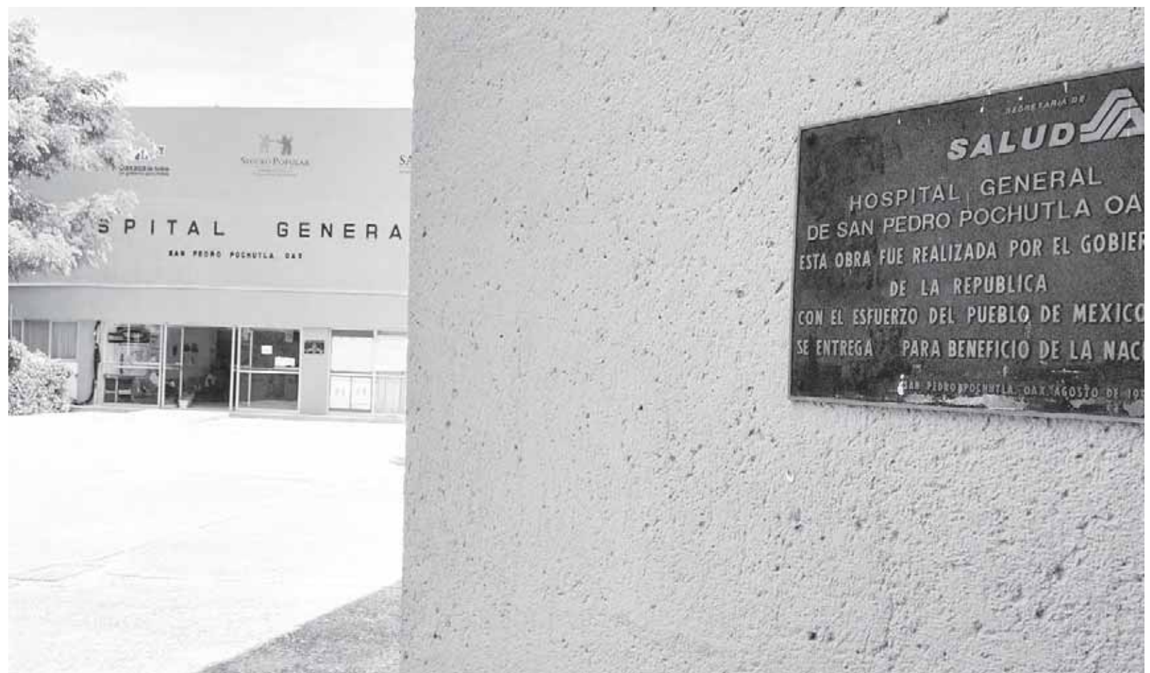
► Dos años detenidas las obras de rehabilitación del área de gobierno del nosocomio.