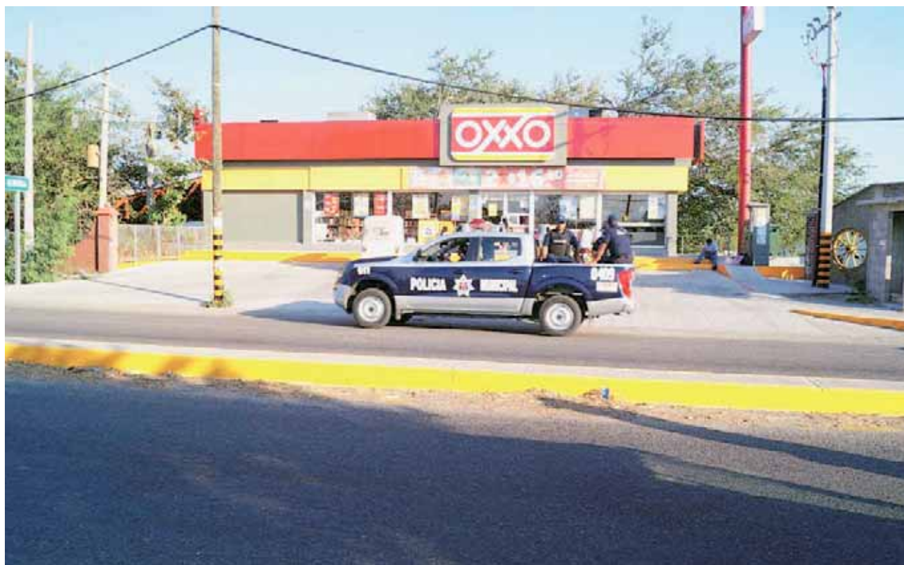
► La desesperada mujer realizaba los depósitos de manera desesperada en la tienda Oxxo.

el nombre de los afectados es omitido, aunque se les hace una invitación a