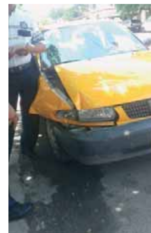
► Del percance se llegó a un feliz acuerdo.

Afortunadamente en este accidente vial no se registraron personas lesionadas sólo daños materiales en ambas unidades de motor.