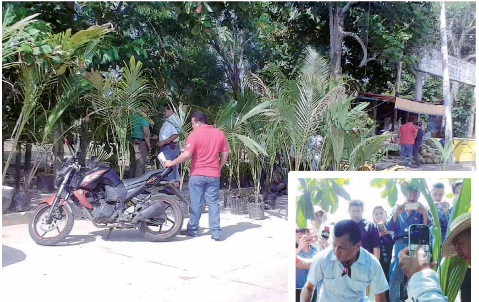
► El objetivo es que el Muro Boulevard Francisco Fernández Arteaga luzca bien.

ya que esto es una actividad de todos, no sólo de una persona, por lo que este trabajo es permanente.