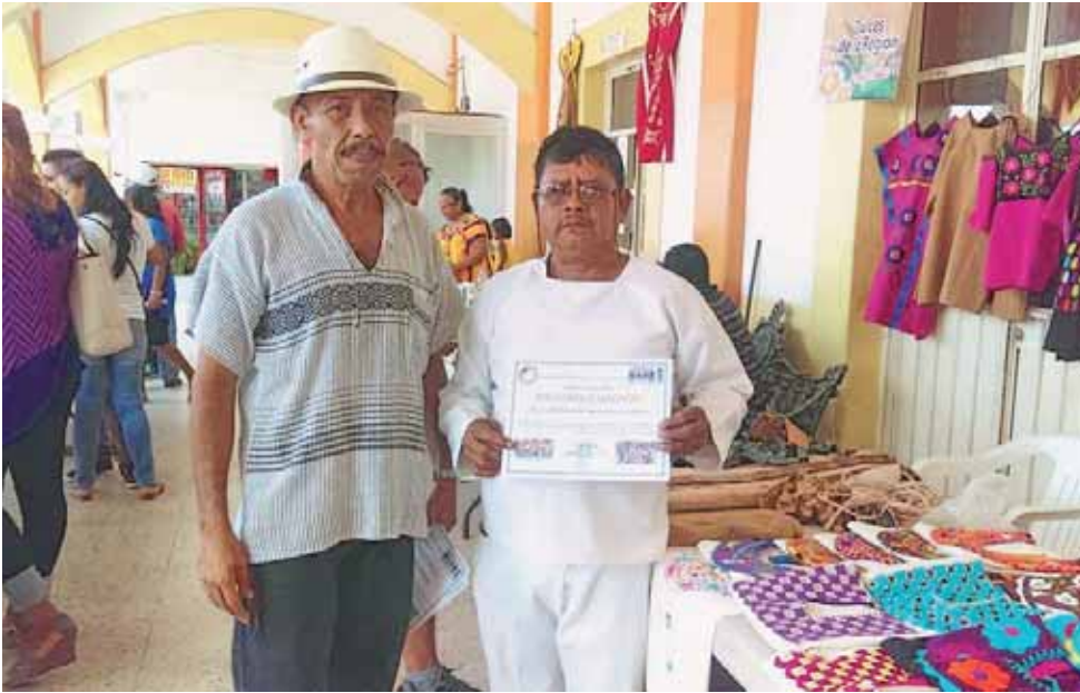
► Los integrantes del Movimiento Indígena, Mestizo y Afromexicano exigen apoyos para sus agremiados.