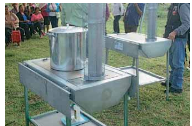
► Las unidades beneficiarán a de las familias de la región.

La intención fue para saber cuáles de ellas tenían que comprar tanques de gas, aunque dentro de su solven-