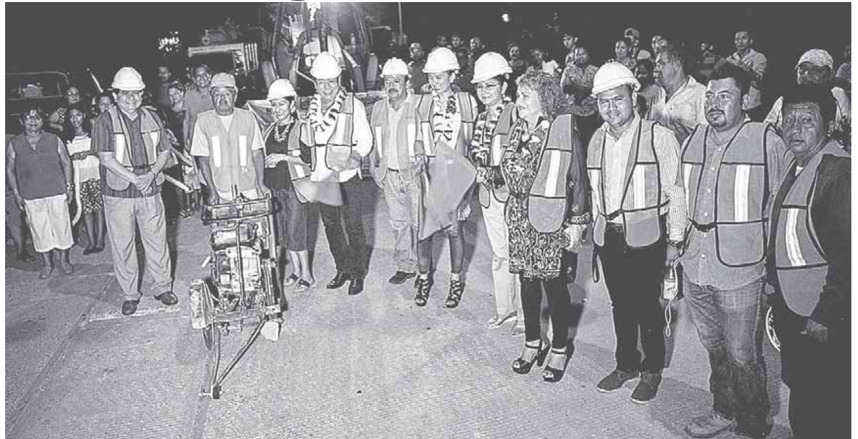
► El presidente municipal de Salina Cruz, cumple con sus promesas de campaña.

Subrayó que se han realizado obras y acciones que retribuyan en el crecimiento del municipio y son obras de vital importancia para acceder a los servicios básicos, son obras que no se ven ya que son subterráneas,