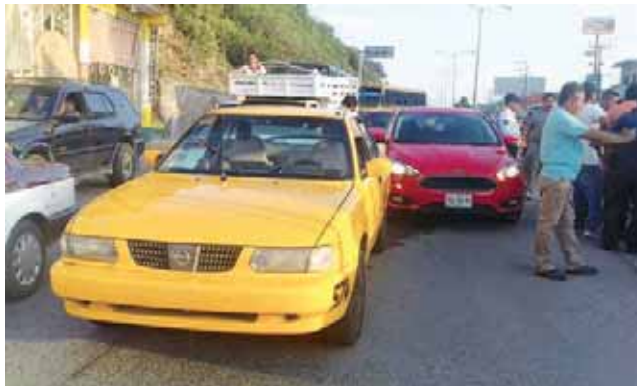
► El hombre se resistía a que la policía se lo llevara.