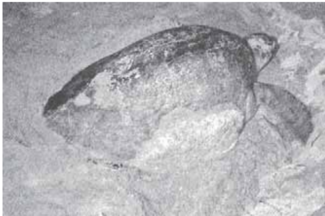
► Los quelonios se preparan para desovar en la playa.

registró más de un millón de anidación de los quelonios, superior a los más de 800 mil que registró la playa Escobilla ubicada en la región de la Costa, catalogada como el principal santuario para la anidación de esta especie en el mundo.