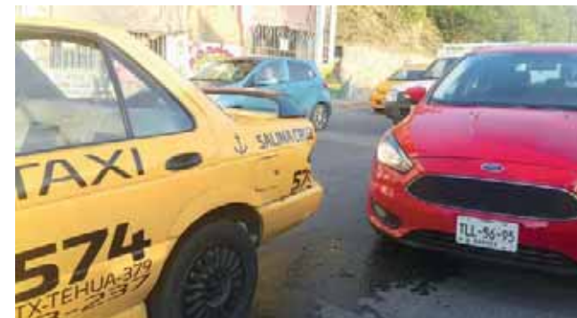
► Las unidades fueron trasladadas al corralón.