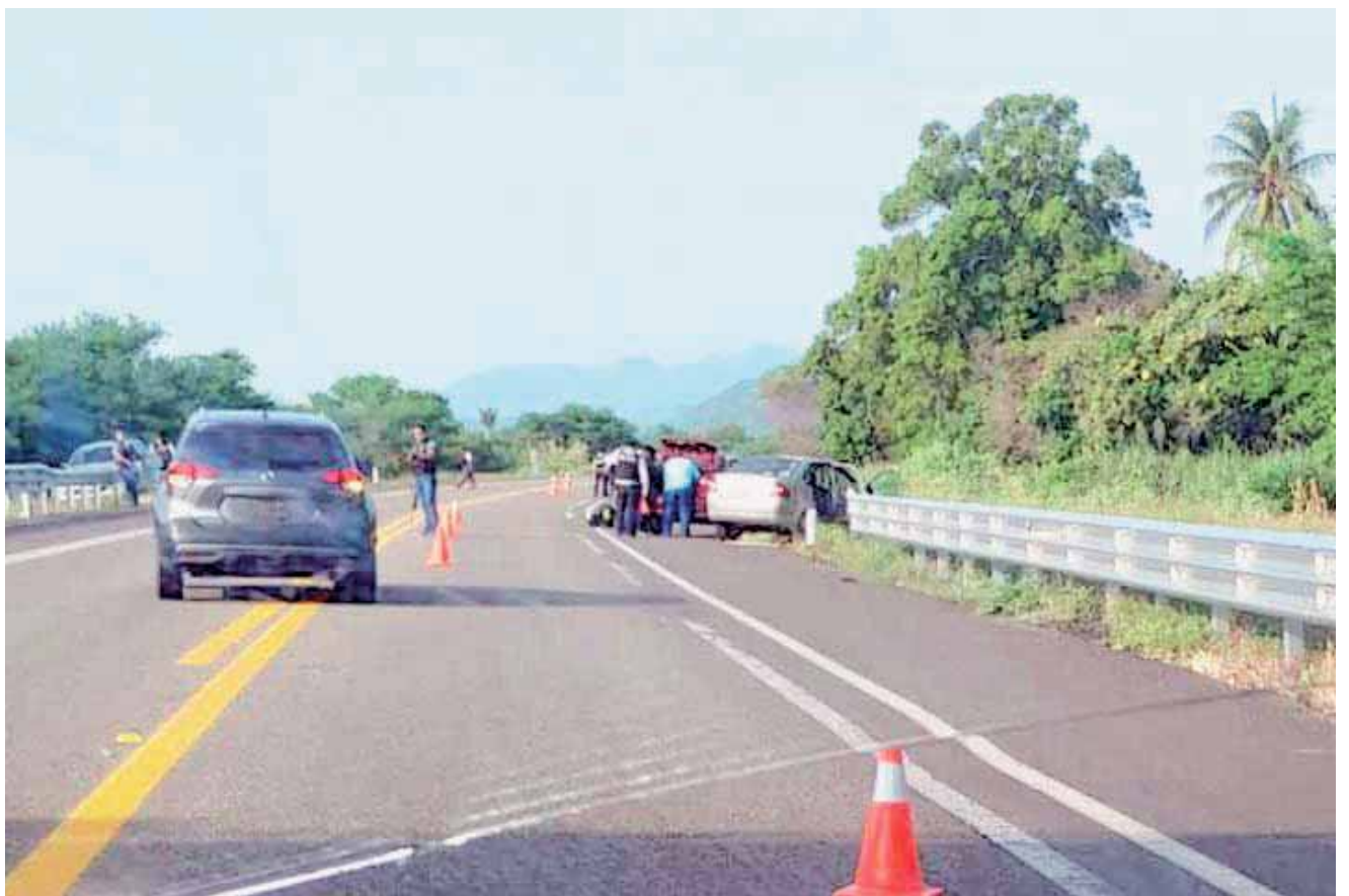
► La unidad quedó a mitad de carretera, mientras que los tripulantes fueron capturados por la policía.

Afortunadamente los policías seguían muy de cerca el coche así se logró en esos momentos la captura de tres de los miembros de una banda presuntamente implicados en la privación ilegal de la libertad de una persona del sexo masculino, al parecer el comerciante, quien logró ser liberado de sus cap-