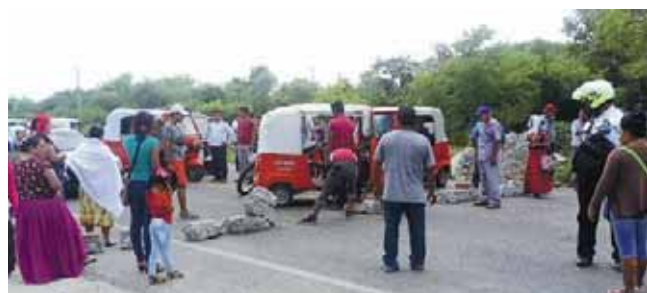
► Molestos, bloquean la carretera.

El lunes, otro grupo político de la Coalición Obrera Campesina Estudiantil del Istmo (Cocoi) bloqueó la carretera bajo las mismas demandas y mismos señalamientos contra la autoridad municipal.