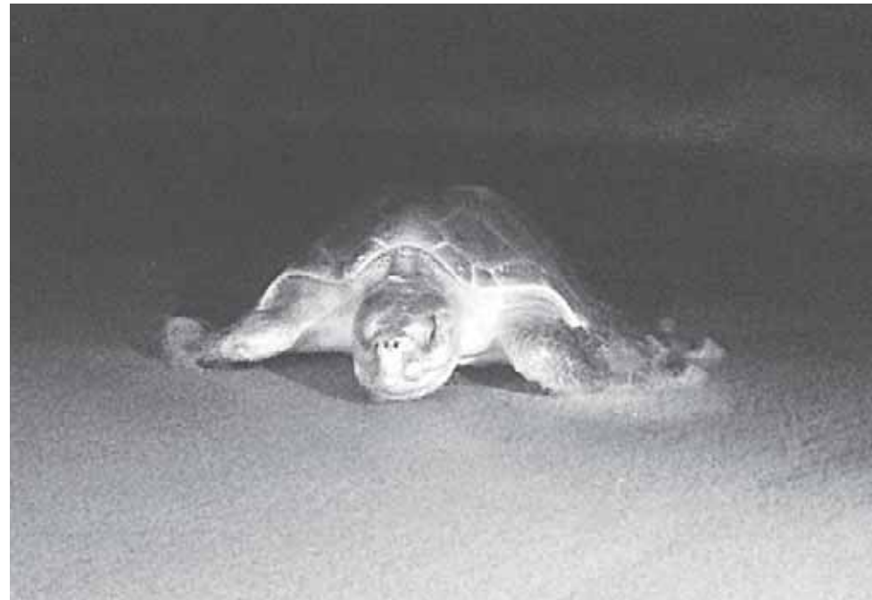
► De acuerdo a los especialistas en Morro cada año hay alrededor de 10 arribadas.