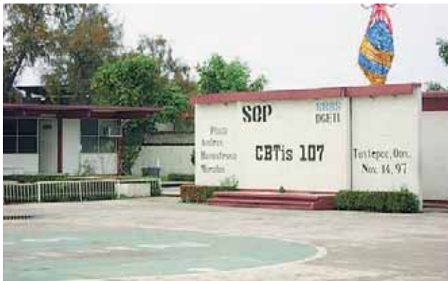
► Cientos de estudiantes se quedan sin recibir clases.