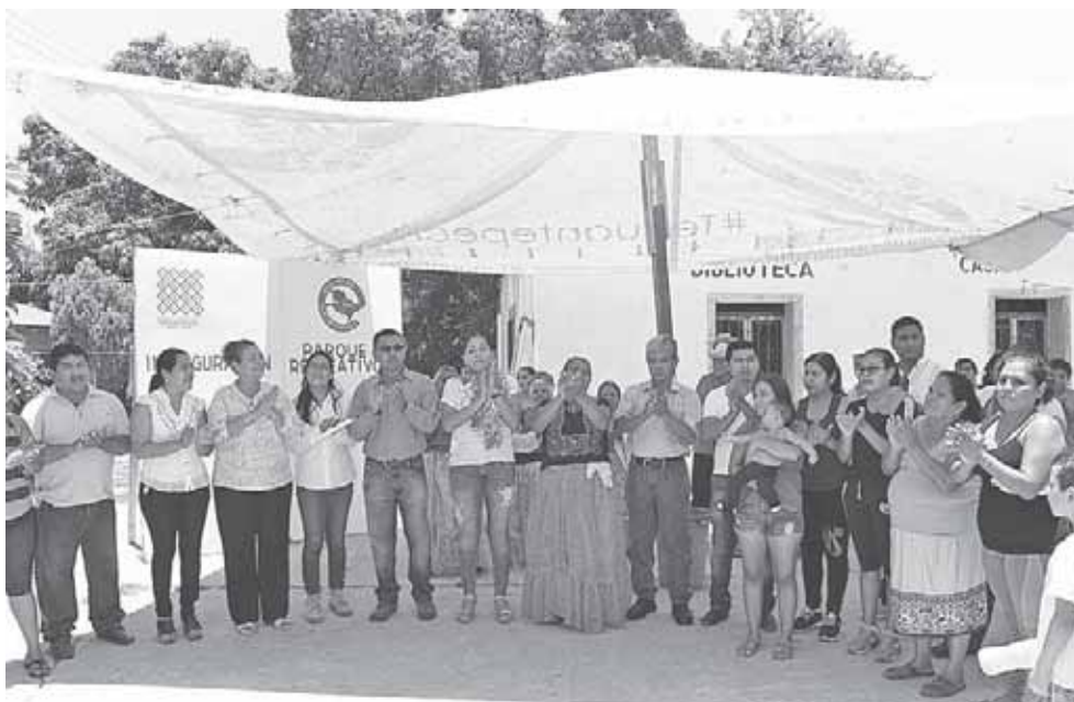
► El parque recreativo lleva el nombre de la presidenta municipal de Tehuantepec.