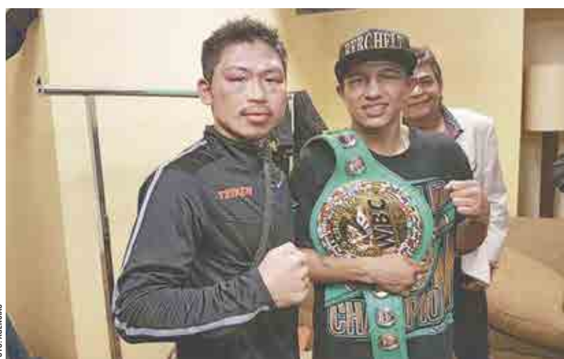
▶ Miguel Ángel Berchelt tiene 28 nocauts.

Ahora, el peleador nacido en Cancún, pero que reside en Mérida, agregó que también está a la espera de que la cadena HBO le otorgue fecha para volver a exponer su corona en suelo estadounidense, pues dicha televisora ha quedado muy satisfecha con sus últimas dos actuaciones, como cuando ganó el cetro en enero pasado ante Francisco “Bandido” Vargas y apenas hace unos días cuando expuso su fajín ante el japonés Takashi Miura.