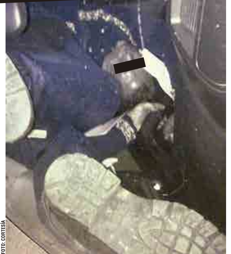
► Falleció en el interior de la camioneta.

Al cierre de la edición, familiares realizaban la identificación legal del cuerpo.