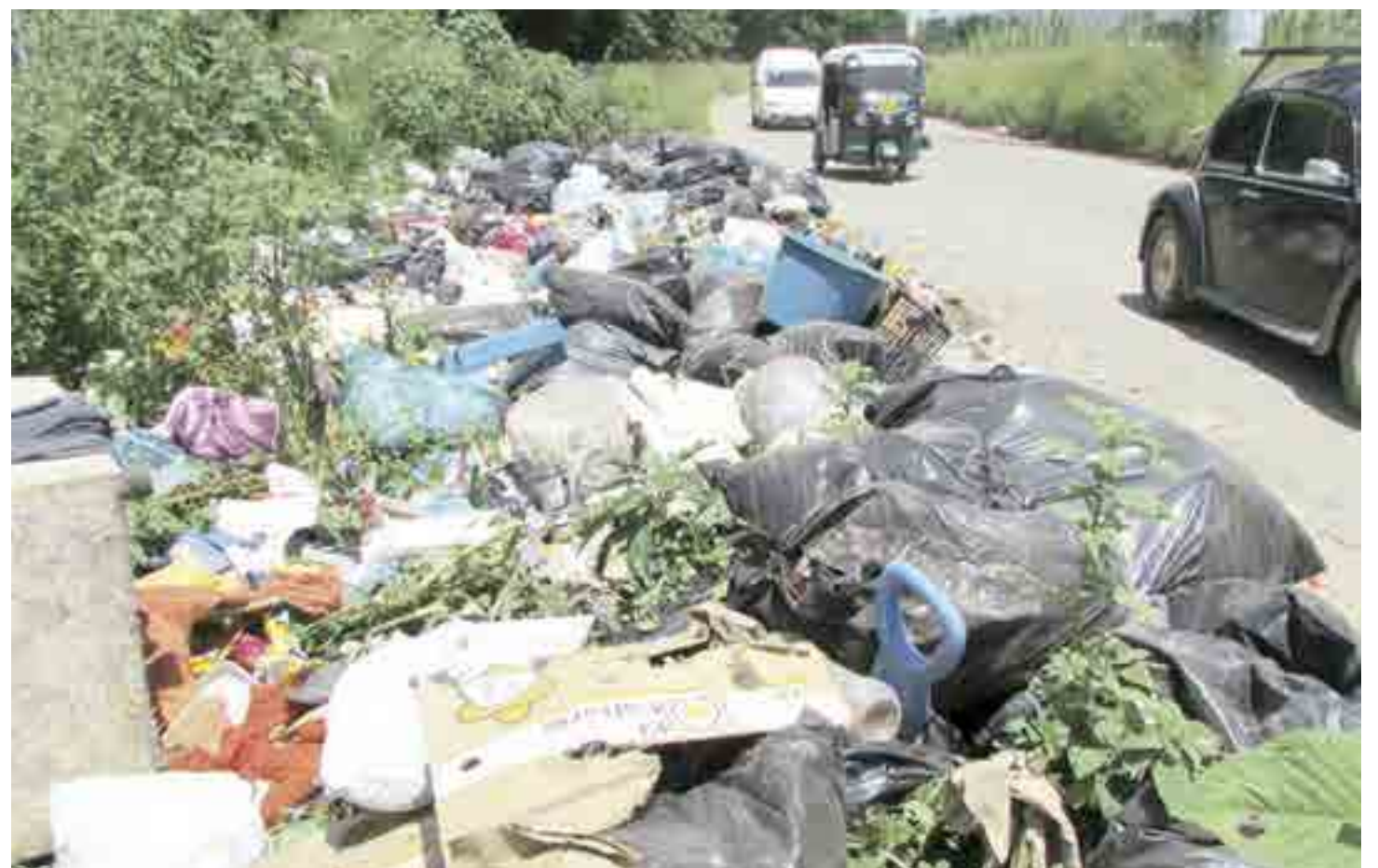
► La gente no entiende y sigue tirando la basura en la calle.

que no existe la cultura del reciclaje de la basura, a la gente le vale “gorro”, que el camión recolector pase en las mañanas, sacan sus desechos y los van a depositar a cualquier lugar, no les importa que estén provocando la contaminación, aparte de que se ofrezca una mala imagen.