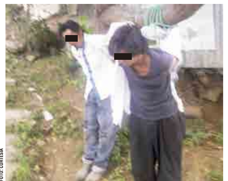
► Los detenidos fueron rescatados por policías.

Otros aprovecharon para pedirles a las autoridades mayor vigilancia en la zona y recorridos continuos de patrullas para evitar acciones violentas que quebrantan la seguridad de quienes habitan en ese lugar y tienen la necesidad de salir para dirigirse a sus centros de trabajo o de vuelta a su domicilio.