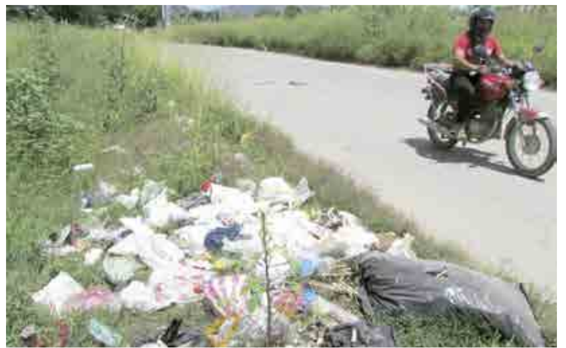
► Piden que las autoridades correspondientes actúen.

Ciudadanos que tienen su domicilio cerca del lugar, añaden