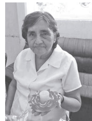
► Les brindan actividades y servicios médicos.