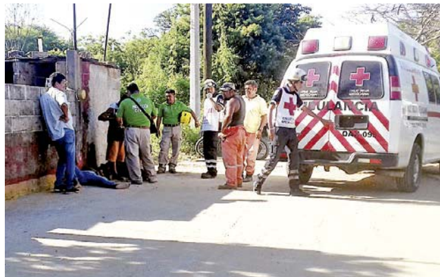
► El arresto ocurrió en la calle Benito Juárez de Bahía a la Ventosa.