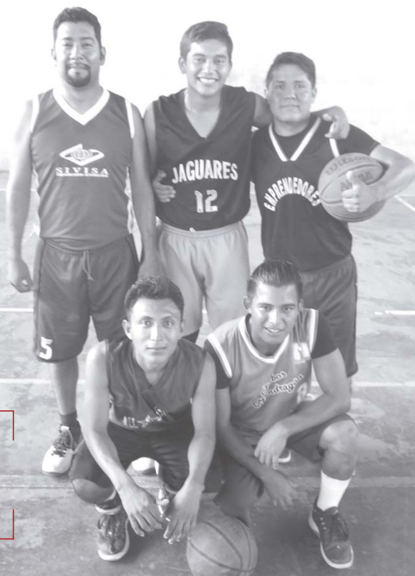
► El equipo Panteras sigue invicto.