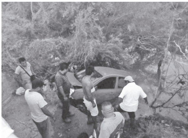
► El Cuerpo de Bomberos extrajo la unidad con ayuda de una grúa.