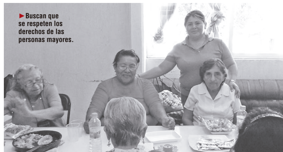
► Buscan que se respeten los derechos de las personas mayores.