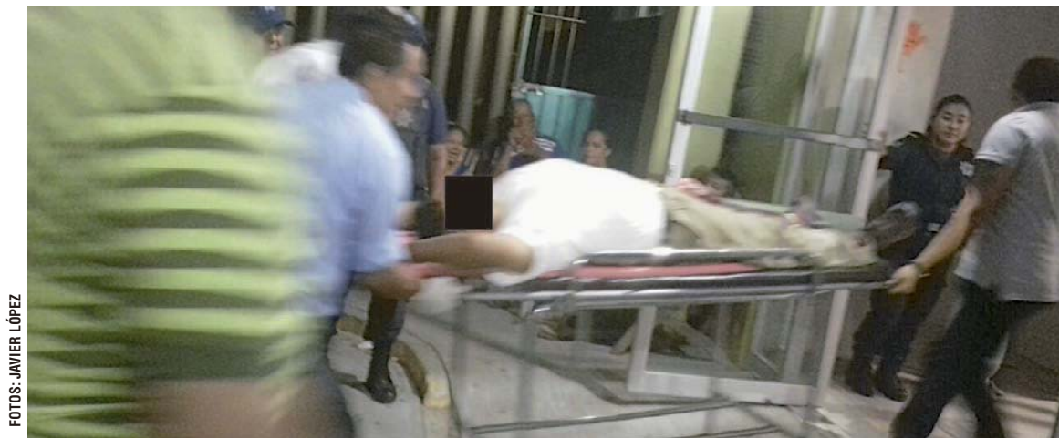
► Agentes investigadores se trasladaron para recibir la declaración del afectado.

Elementos de la Agencia Estatal de Investigaciones se trasladaron al nosocomio para recabar la declaración del lesionado y también invitarlo a realizar la denuncia correspondiente para tratar de dar con los responsables.