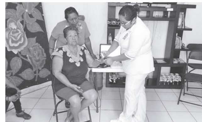
► Están enfocados a promover la atención integral del adulto mayor.

De igual manera se brinda el servicio de curaciones, toma de glucosa, colesterol, exámenes de la vista de forma gratuita y demás beneficios como por parte del Instituto Nacional de Educación para los Adultos INEA y del Instituto de Capacitación y Productividad para