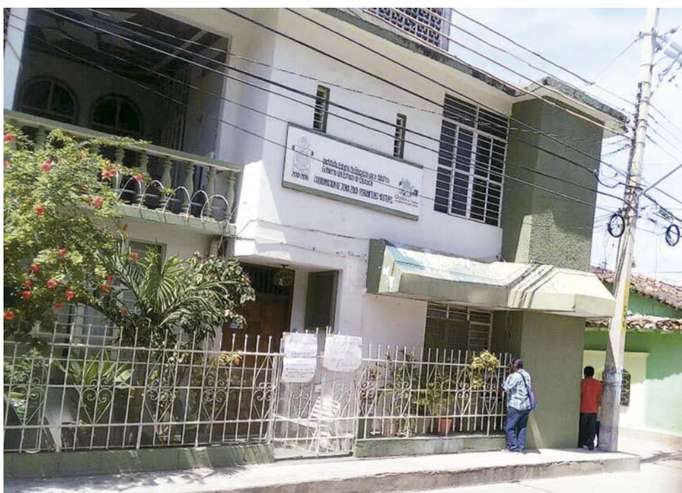
► La instalación fue bloqueada desde el lunes.

Los promotores han denunciado que ante la falta de subsidio, ellos han tenido que costear de sus propios recursos para poder sacar adelante su trabajo que se les encomienda.