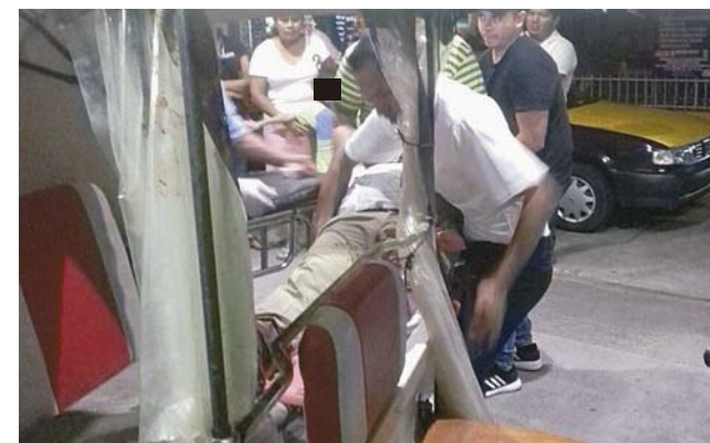
► Los asaltantes viajaban a bordo de un mototaxi, en el que huyeron.