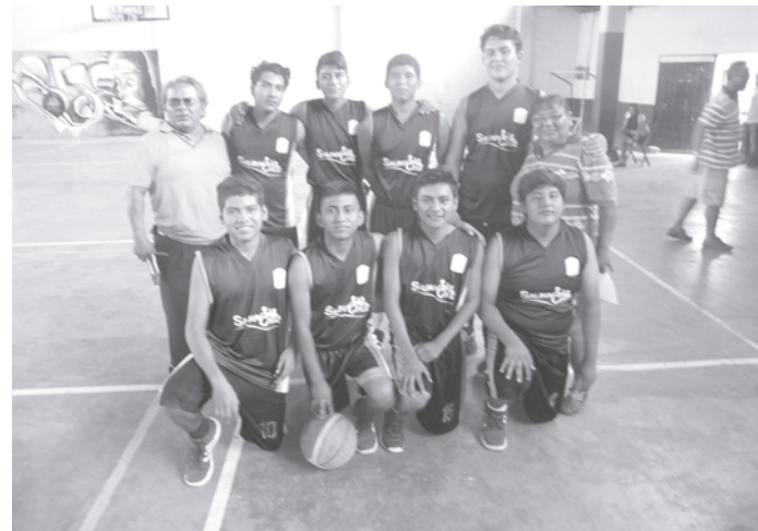
► Francisco I. Madero con su primera derrota.