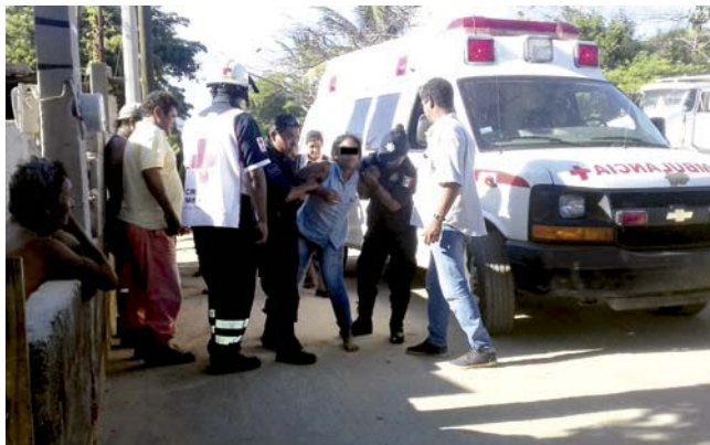
► Los detenidos fueron turnados a la instancia correspondiente.