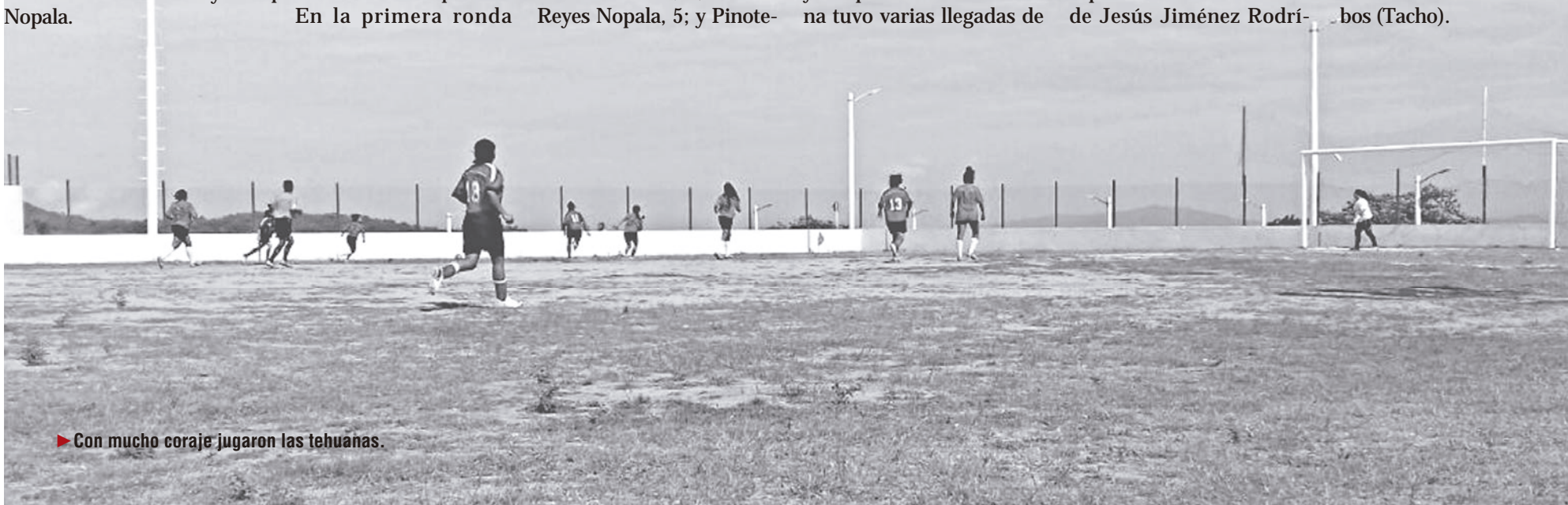
► Con mucho coraje jugaron las tehuanas.