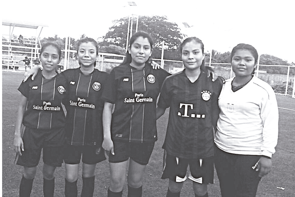
► Real San Blas ya empezó a remar.