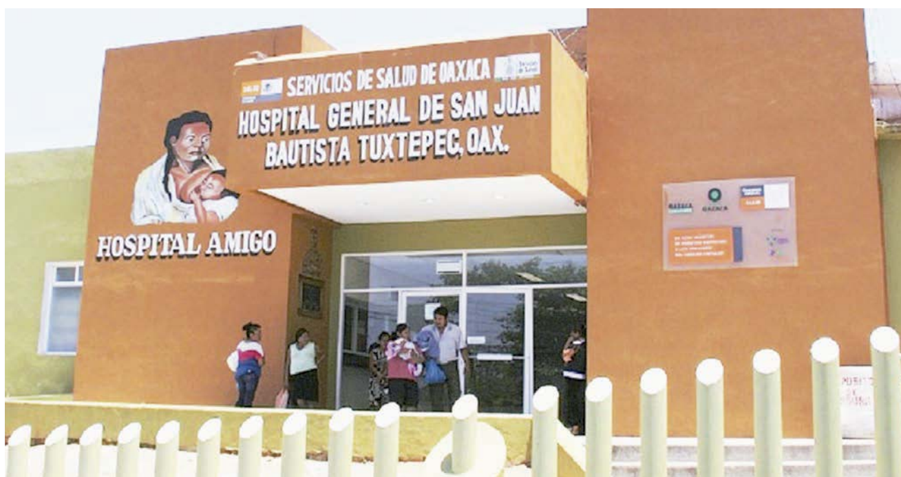
► La mujer acusó al personal médico y de enfermería de negarle la atención médica.