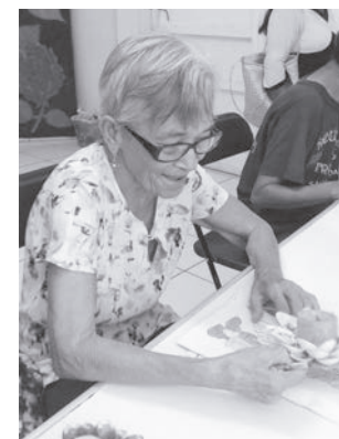
► Refrendan su apoyo a los abuelitos.