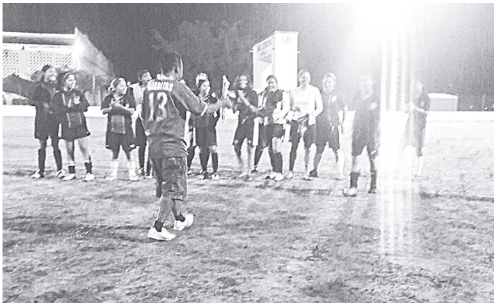
► Recibiendo su reconocimiento.