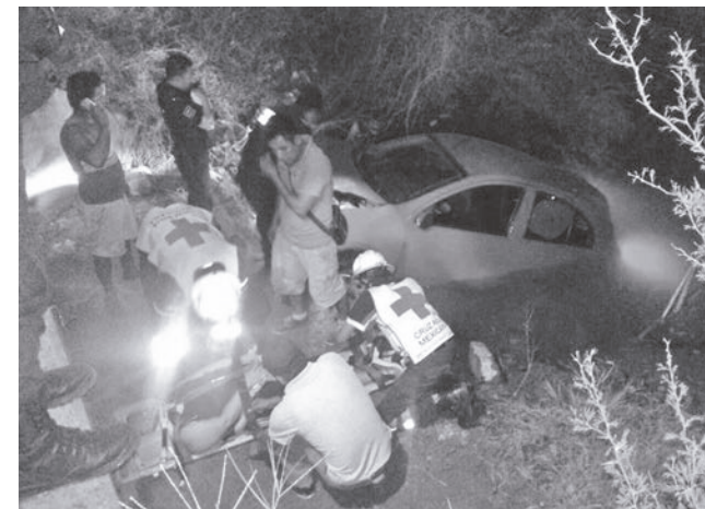
► La afectada fue trasladada a un nosocomio.

En el lugar se presentaron elementos de la Policía Municipal y personal de Protección Civil, quienes abanderaron la zona desviando el tráfico vehicular.