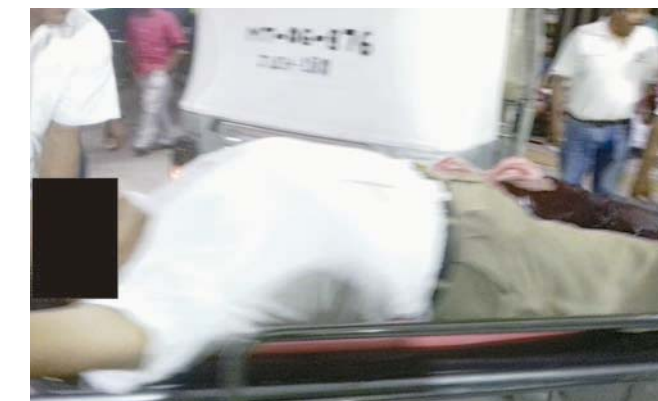
► El herido fue auxiliado por ciudadanos que se encontraban en la zona.