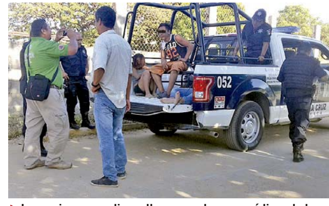
► Los vecinos procedieron llamar a los paramédicos de la Cruz Roja Mexicana.

LOS GRITOS DE UNA JOVEN ALERTARON A LOS VECINOS