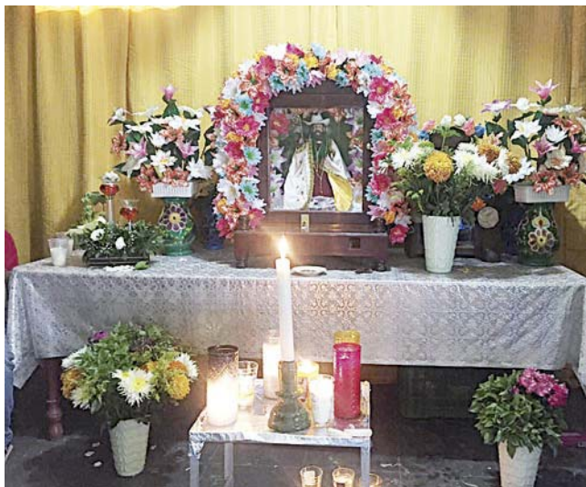
► La imagen es honrada con veneración.