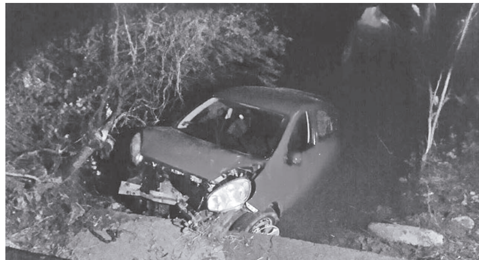
► La ciudadana perdió el control de su vehículo en una curva pronunciada.

Más tarde, el Heroico Cuerpo de Bomberos sacó el auto compacto del agua con apoyo de una grúa, para que fuera remolcado al corralón correspondiente.