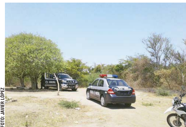
► La intervención policial llegó en el momento oportuno.

Por fortuna en esta ocasión la pronta intervención policiaca logró hacer que el asalto fuera interrumpido, por lo que los guardianes del orden invitaron al empleado a presentar su denuncia correspondiente ante las oficinas del ministerio público de esta ciudad.