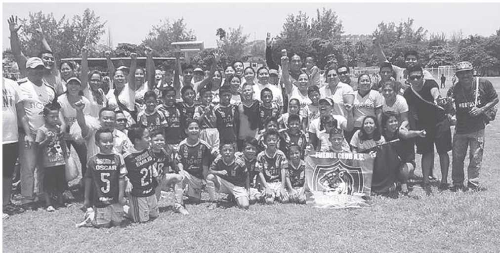
► Así festejaron el campeonato los jugadores y familiares del equipo Tigres.