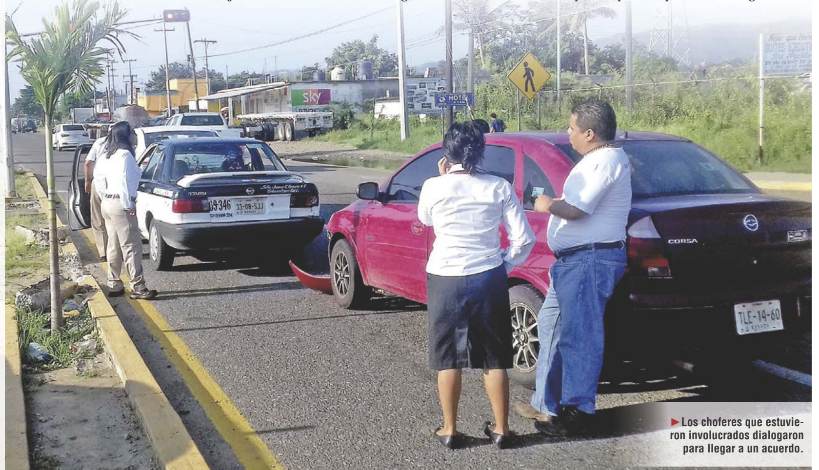
► Los choferes que estuvieron involucrados dialogaron para llegar a un acuerdo.

Los conductores, en su defensa alegaban no tener la culpa y después de varios minutos de diálogo llegaron a un acuerdo fraternal, por lo que no fue necesaria la presencia de la grúa.