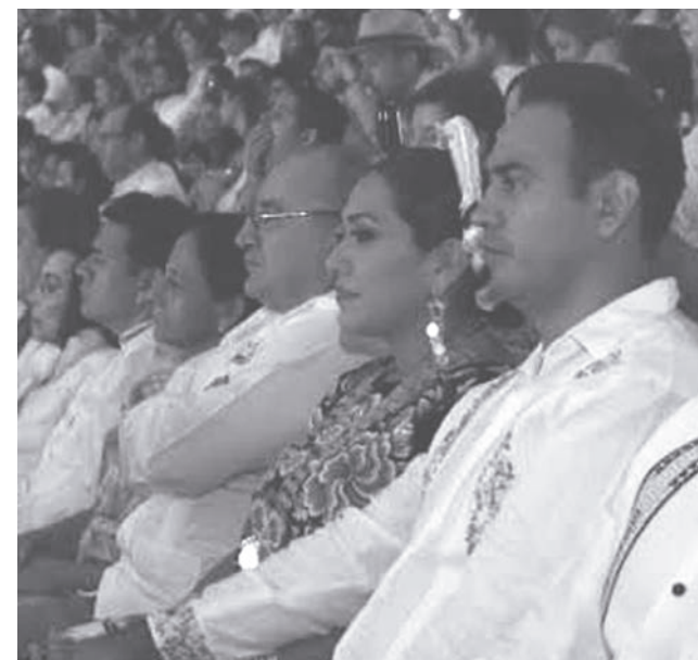
► La presidenta municipal y su esposo estuvieron presentes.