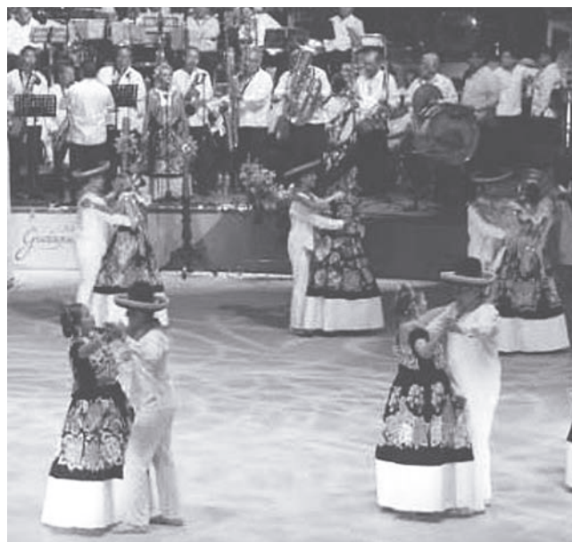
► Fue una de las delegaciones más esperadas durante la edición.