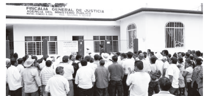
► Los inconformes afuera de las instalaciones.

Los manifestantes se retiraron a su lugar de origen, sin causar afectaciones ni desmanes, esperando ver favorecida su petición.