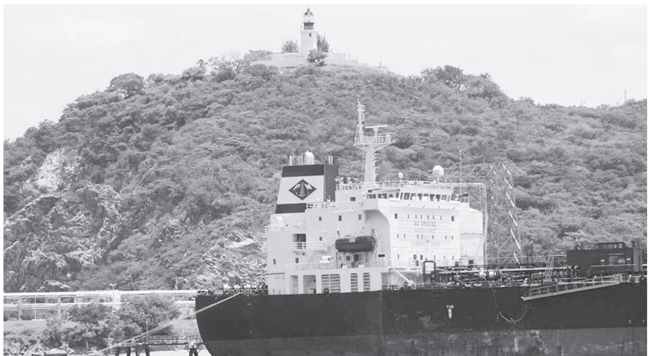
► Una de las pocas embarcaciones que llega al muelle de la Administración Portuaria Integral.