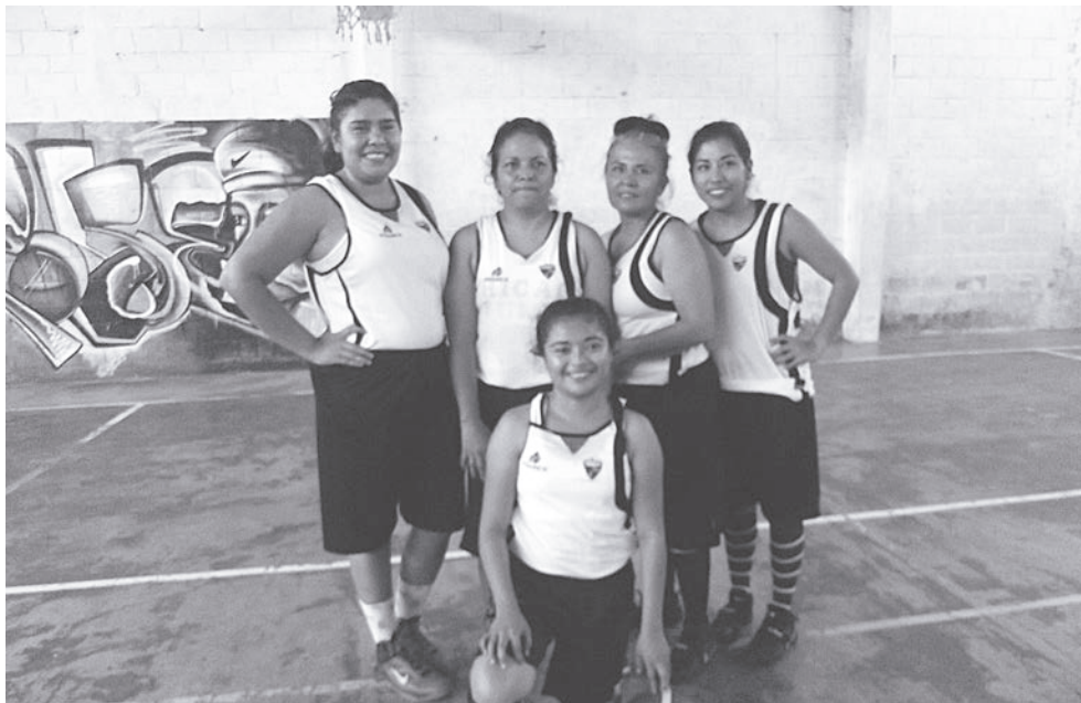
► Magic's desmejoró los últimos sets.