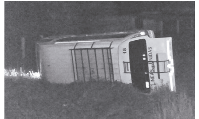
► La unidad quedó a un lado de la carretera.

Los mismos pasajeros solicitaron el apoyo de las corporaciones policiacas,