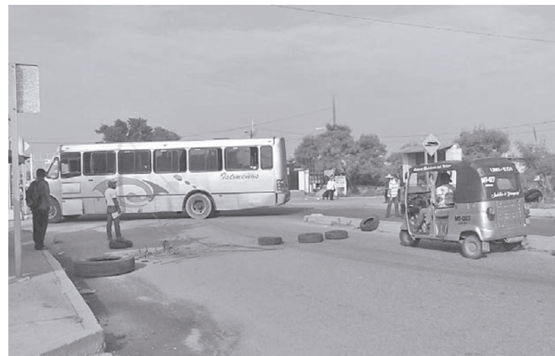
► Los productores aseguran que los recursos los destinan a organizaciones sociales y no a los campesinos.