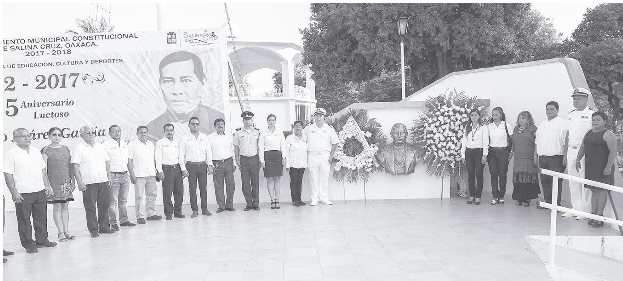
► Cada uno de los asistentes al acto cívico en la plaza principal que se ubica en el zócalo del municipio.