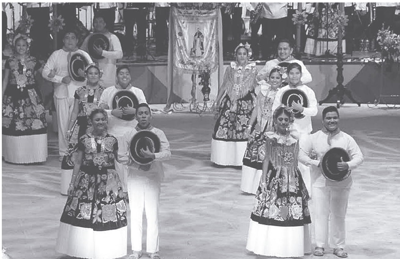
► Muestran al mundo entero la cultura y belleza de Tehuantepec.

Santo Domingo Tehuantepec es una población con profunda e invaluable riqueza cultural, cuyas costumbres y tradiciones se mantienen vivas gracias al arraigo que tienen entre sus pobladores. Elementos como el mundialmente reconocido "traje de tehuana", así como los ahogadores hechos con oro puro, los resplandores y los sones tehuanos son ejemplos significativos de este fructífero proceso de interculturalidad, la cual se mostró al mundo en esta Guelaguetza 2017.