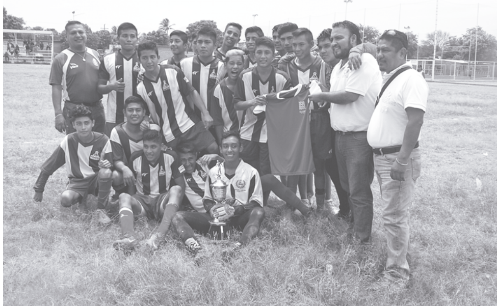
► Dep. Tehuantepec campeones.

chez Gutiérrez como central, Elvis García Díaz como asistente uno y Luis Manuel Alvarado Dichi como asistente dos; el encuentro estuvo muy reñido en el terreno de juego, pese a que los de la Real Soledad mantuvieron más tiempo el esférico en su poder no pudieron triangular jugadas que les permitiera perforar el arco del cancerbero del Deportivo Tehuantepec; por su parte la ofensiva de Tehuantepec puso en aprietos la portería del Real Soledad con sendos contragolpes, pero finalmente se fueron al descanso con el empate a cero goles.