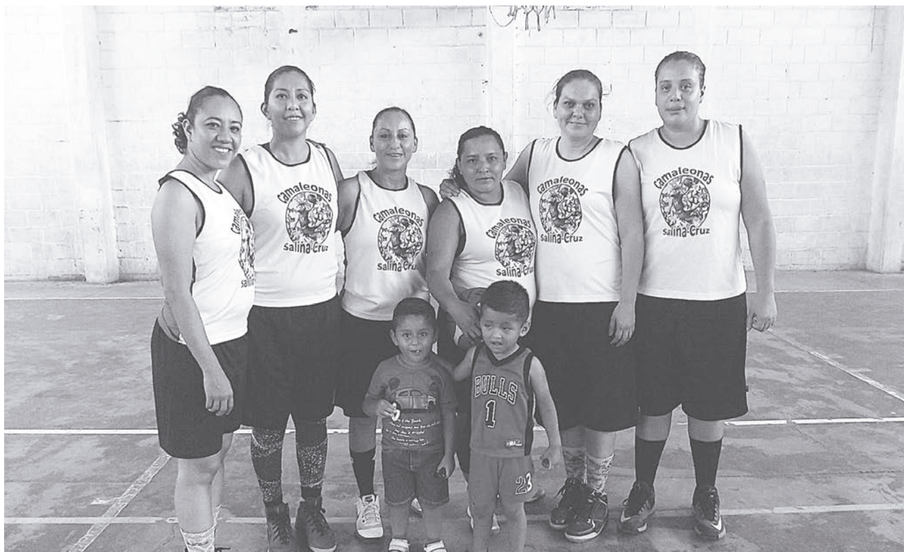
► Camaleonas tercer lugar.

En la cuarta y última parte del juego, ya la situación estaba dada en favor de Camaleonas quienes sin