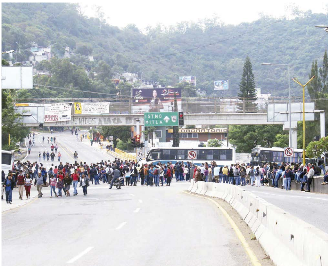
► En la imagen, una de las recientes medidas de presión que ejerce la Sección 22 sobre el gobierno para que les concedan sus peticiones.

cio colaborativo entre el gobierno de la República y las entidades federativas, se comparó el número de personal pagado con el FONE contra el número de personal adscrito a las escuelas. Los resultados demuestran avances, aunque el problema histórico sobre el (mal) manejo de la nómina magisterial persiste.