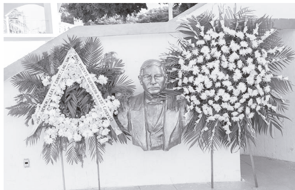
► La ofrenda floral que fue depositada a Don Benito Juárez García.