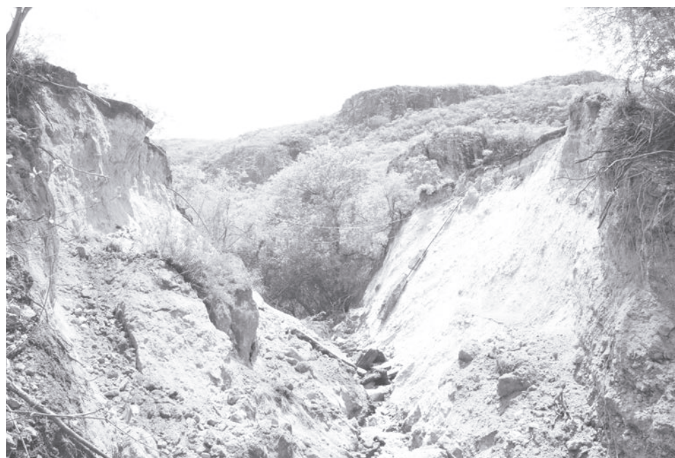
► Uno de los socavones que sufrió la carretera con las recientes tormentas.

Además de escuchar las intervenciones de los diputados de la Comisión y las recomendaciones para generar mayor eficiencia en la Fiscalía, el titular de la dependencia fijó su postura al frente de la institución, al señalar que se buscará recuperar la confianza de la ciudadanía.