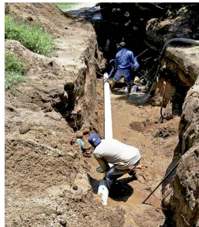
► La red de agua potable presenta averías.

Dijo que Salina Cruz creció de manera desproporcional y debido a una mala planeación, ha provocado que en algunas colonias o sectores pre-