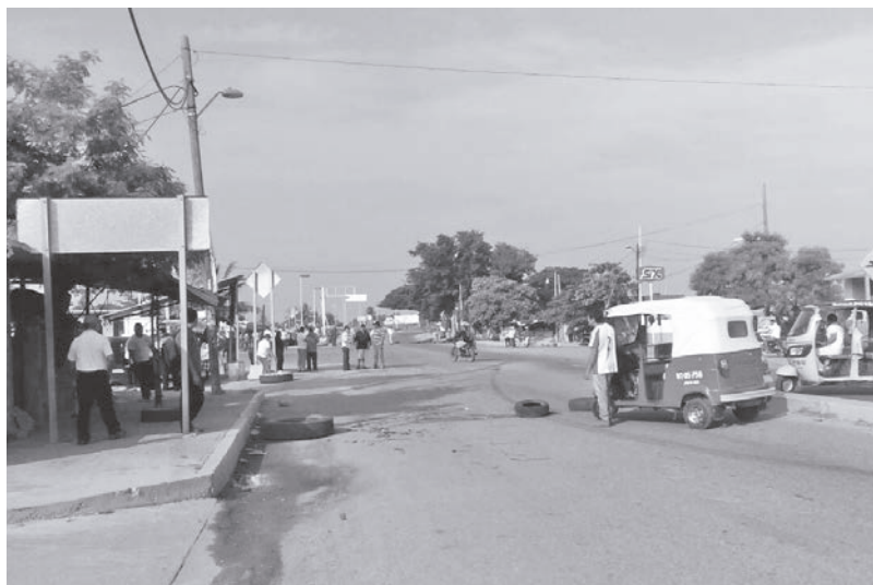
► El bloqueo afecta a decenas de juchitecos que buscan trasladarse a sus destinos.