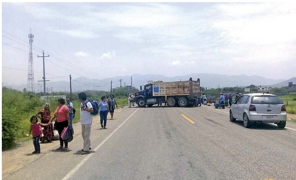
► Ya la comunidad en general, está harta de tanto bloqueo registrado en Salina Cruz.

Estamos al borde del abismo, no hay inversión y la poca que hay se ve amenazada por los constantes bloqueos en las principales redes carreteras de la región.