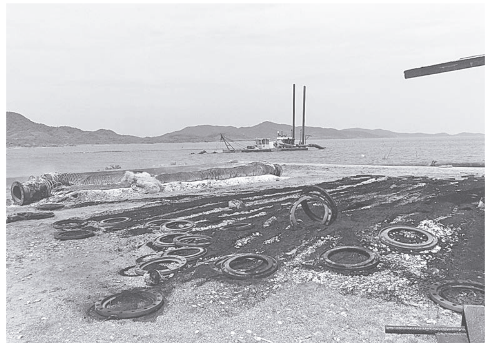
► Reducidos a cenizas quedaron los materiales de la constructora.