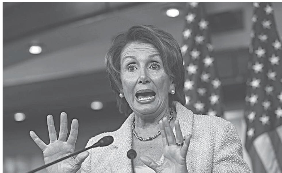
► La líder de la minoría demócrata de la Cámara de Representantes, Nancy Pelosi.

En un tono similar, el líder de la minoría demócrata en el Senado, Chuck Schumer, llamó "sin corazón" a la propuesta republicana y aseguró que la nueva iniciativa es incluso "más cruel" que el proyecto legislativo sobre salud aprobado por la Cámara de Representantes en mayo pasado.