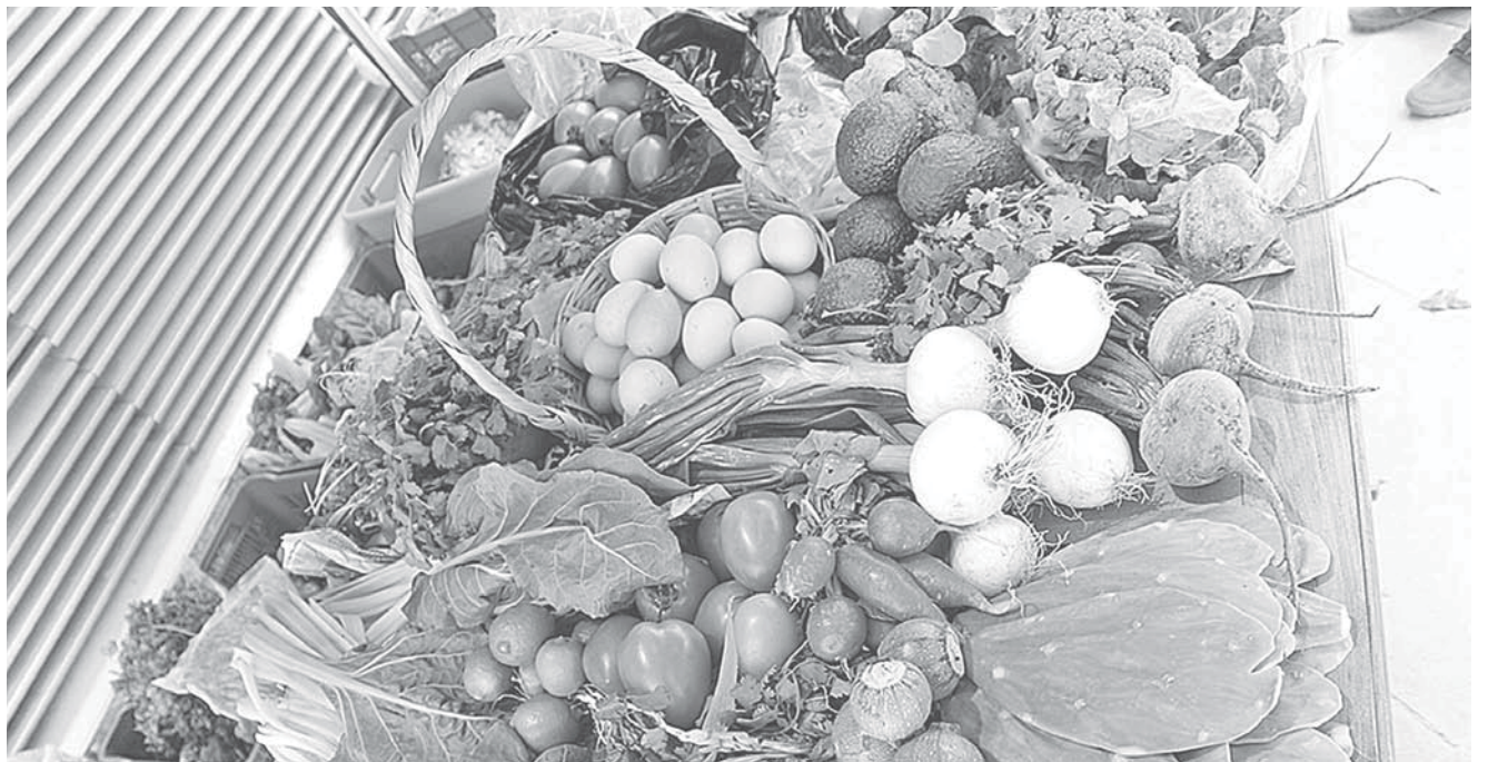
► Asimismo hubo una baja de tomate verde, uva, chile poblano, lechuga y col.

Los productos que registraron mayores alzas de precios fueron: el chayote, transporte aéreo, jitomate, papa y otros tubérculos