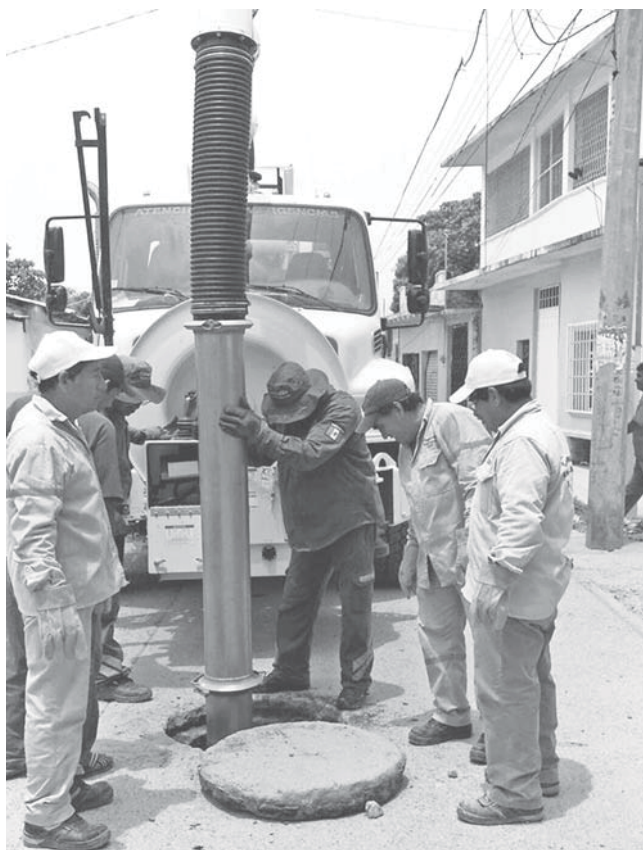
► Se podrían prolongar los trabajos.

El funcionario municipal aseguró que en estas dos semanas se han realizado avances significativos en el primer cuadro de la ciudad, así como agencias municipales y barrios como La Noria, San Isidro Pishishi, Santa María, San Juanico, San Sebastián y Santa Cruz Tagolaba; "Puntos que estaban