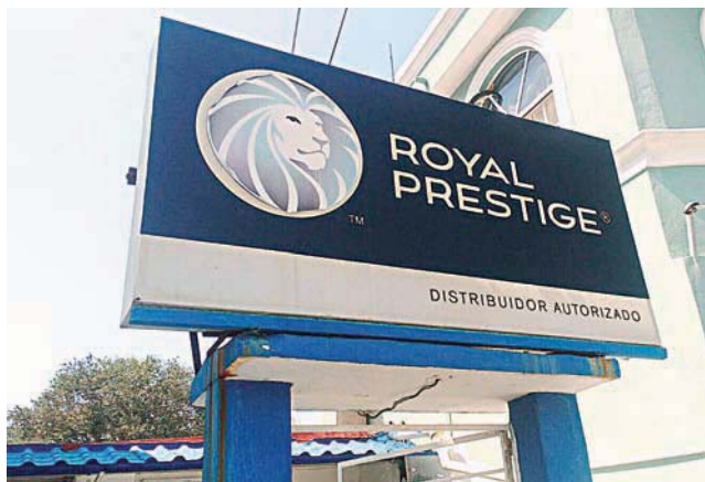
► La empresa en la que laboran los inconformes.

Estas personas en su mayoría en edades entre los 17 y 28 años de edad, fueron contratadas por el representante de la empresa y algunos de sus colaboradores, en donde les ofre-