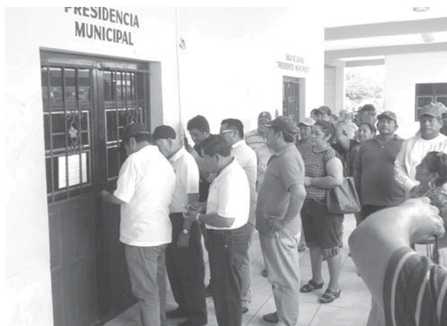
► Pobladores inconformes.