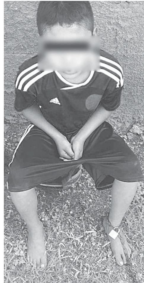
► La cadena la tenía en el pie izquierdo y a un lado tenía un traste para hacer sus necesidades fisiológicas.