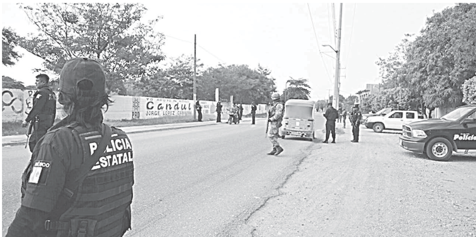
► La policía realizó un operativo, pero no fue exitoso.

Con la intensión de evitar el atraco, el joven aceleró y se desvió por un camino