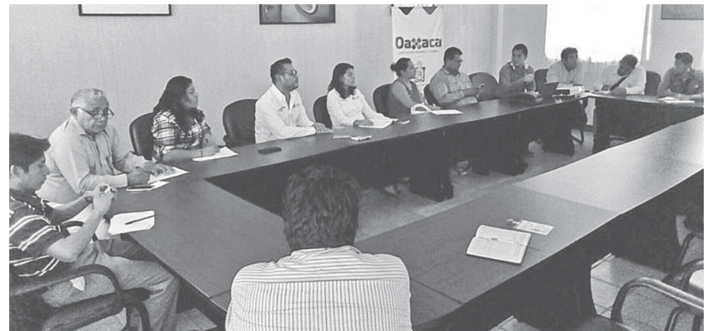
► Durante la reunión que sostuvieron en el auditorio, que encabezó la regiduría de Turismo y Desarrollo Económico.

Los interesados podrán solicitar la información en la oficina de la Regiduría, ubicada calle Acapulco colonia centro, altos del Palacio Municipal.