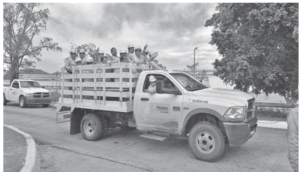
► En la primera etapa, se contempla emplear a 200 salinacruceses.

Finalizó diciendo que es importante que los inversionistas tengan la plena confianza que no habrá más violencia, lo que se busca es generar más fuentes de empleo.