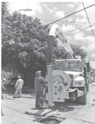
► El equipo realizó las acciones durante la semana.