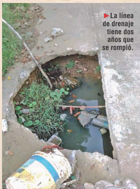
► La línea de drenaje tiene dos años que se rompió.