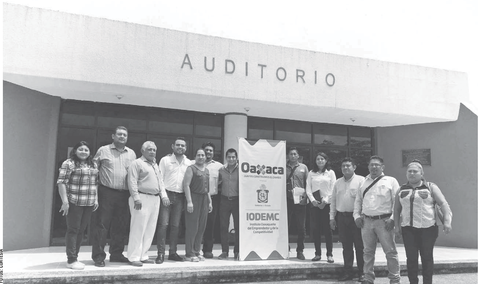
► En la junta estuvieron el responsable del departamento de Incubadoras y Aliados, junto con el regidor de Economía.

tamento de Incubadoras y Aliados del IODEMC, explicó que dentro de las cinco convocatorias que se lanzaron, está la Beca de escalamiento emprendedor con monto de $500,000, Incubación de empresas $3,500,000, Consultoría a emprendedores y empresas $1,165,000, Fortalecimiento de las capacidades de las incubadoras de empresas $460,000 para aplicarlas y ser beneficiarios de los programas, consistentes en Capacitación y Consultoría Empresarial, Incubadora de