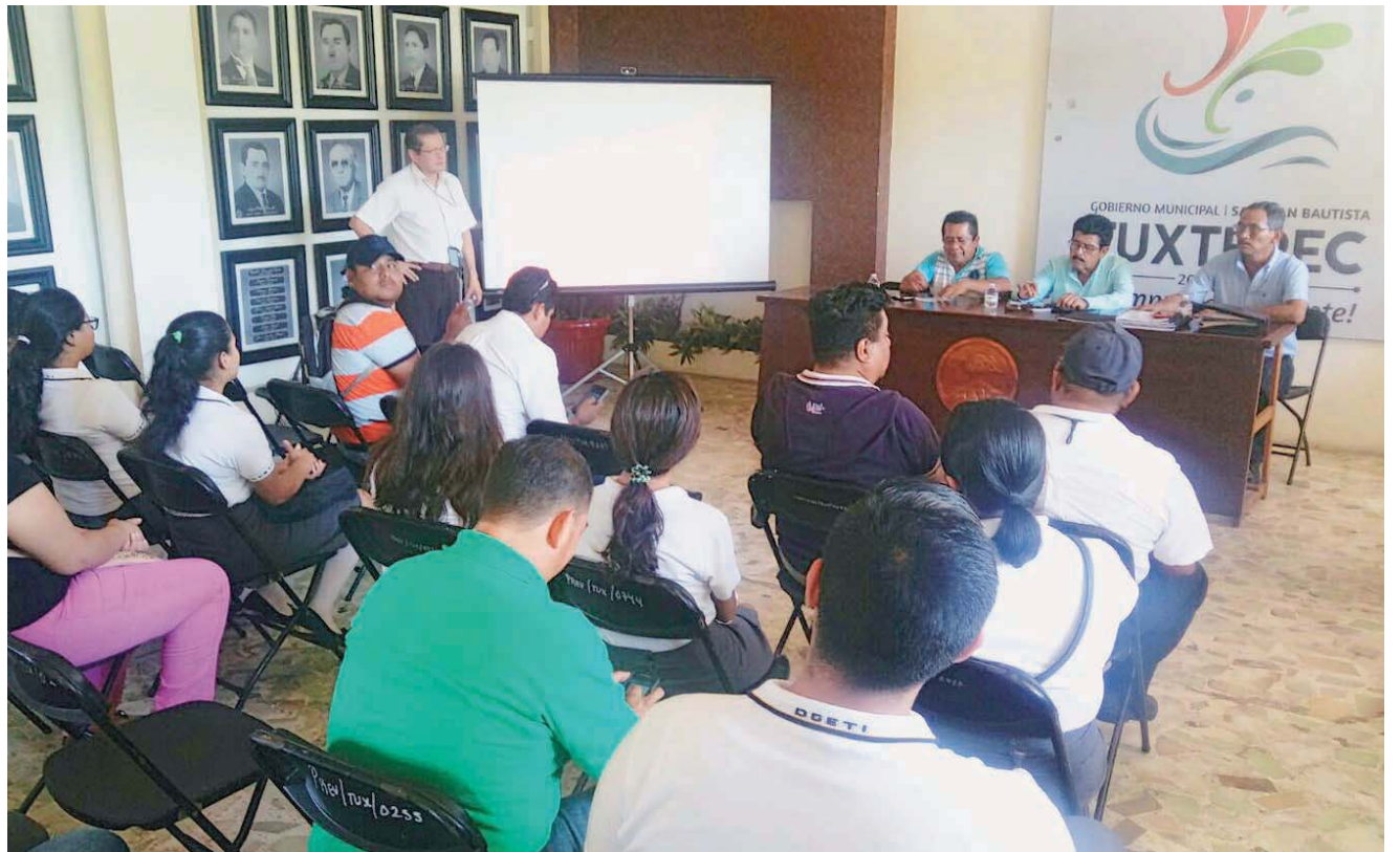
► Conferencia sobre la importancia de las rutas en el año 1400.

que se podrán seguir disfrutando este jueves en el marco de las Fiestas de San