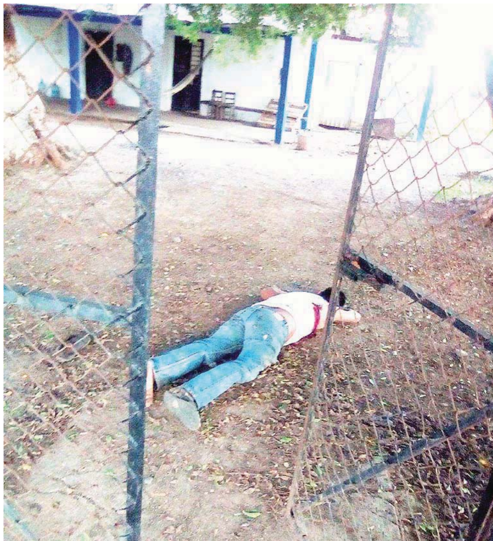
► En la escena del crimen, no fueron localizados casquillos percutidos de ningún tipo de arma.

Entre las versiones arrojadas por algunos testigos, trascendió una de las cuales confirmaban que los homicidas del caporal lo habrían cometido un par de suje-