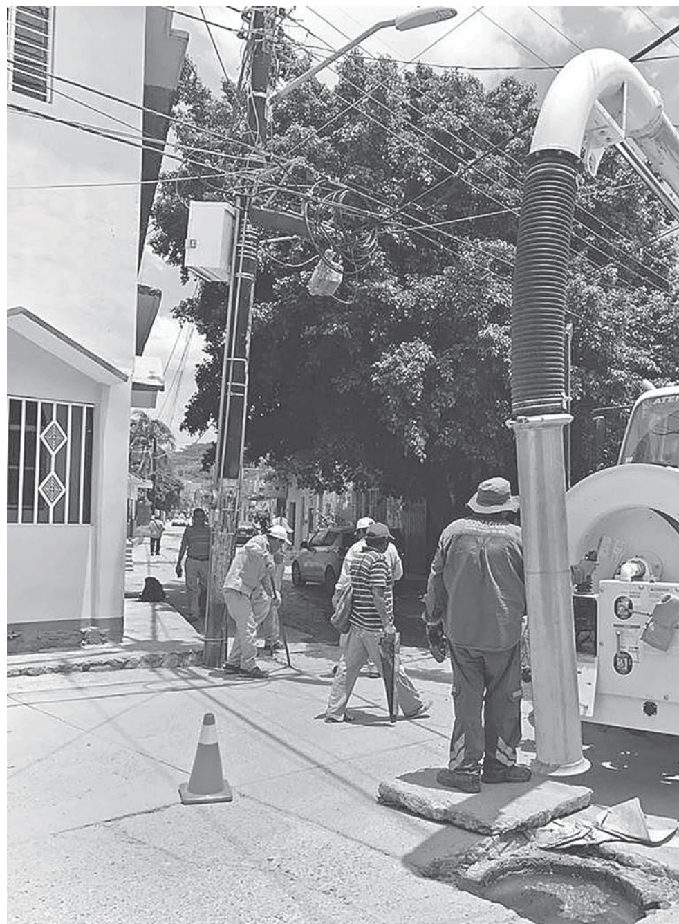
► Las acciones se llevaron a cabo en las zonas más afectadas.

Por último es de mencionar que de acuerdo al itinerario ésta será la última sema-