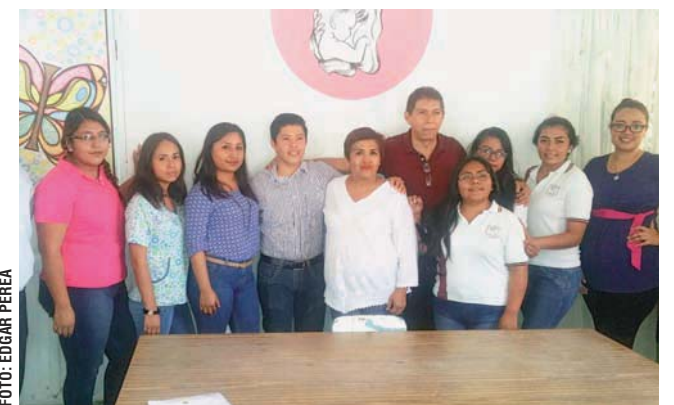
► Me permito un momento y lo comparto contigo, el nombre del taller

en apoyo a las madres solteras, y la asociación es sin fines de lucro pues no recibe ningún tipo de ayuda ni estatal ni federal, mucho menos municipal.