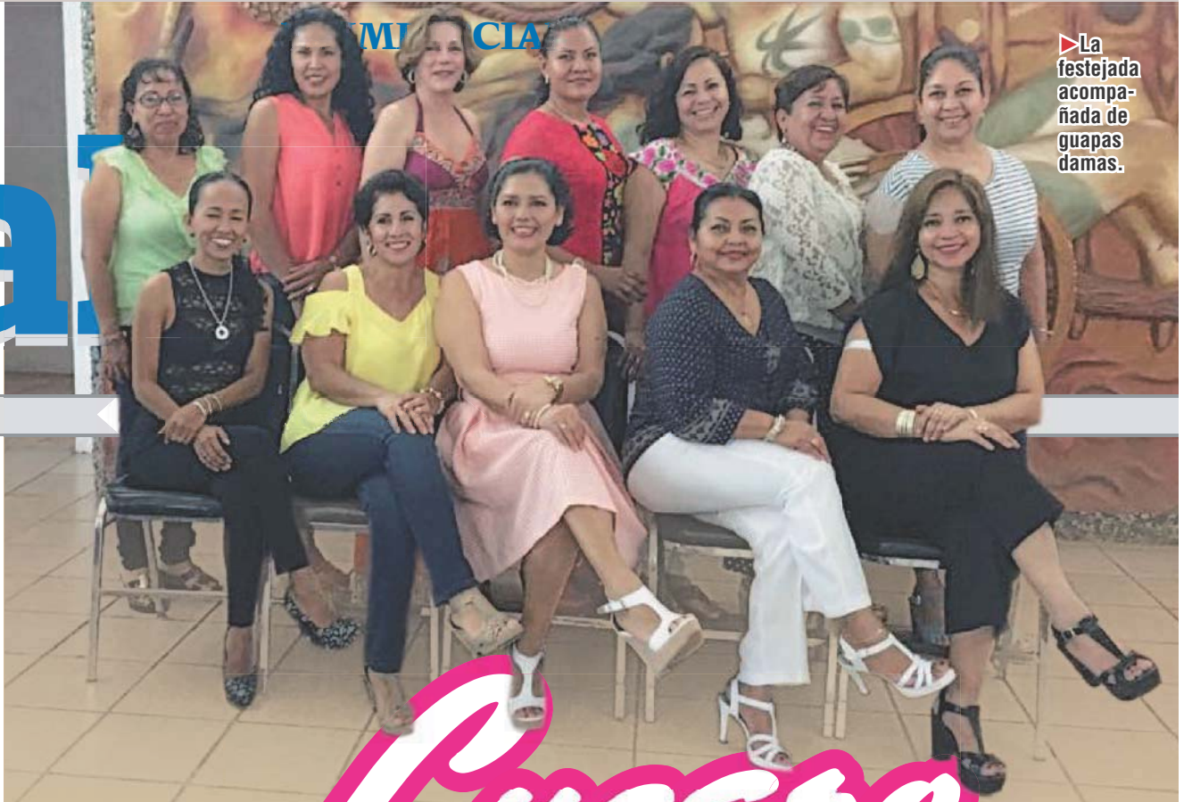
► La festejada acompañada de guapas damas.