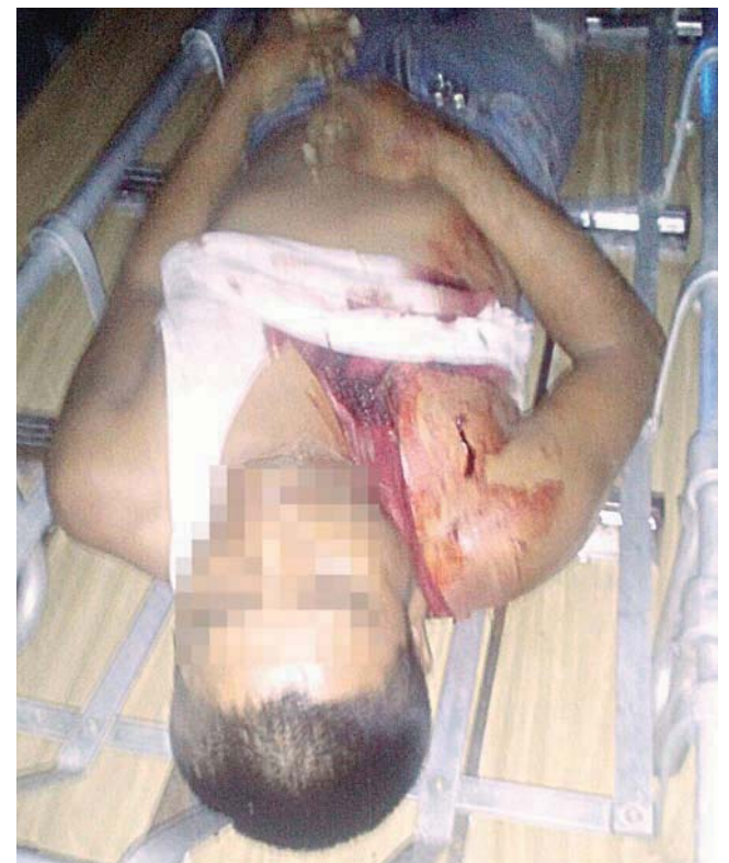
► La AEI ya investiga el hecho tan lamentable.