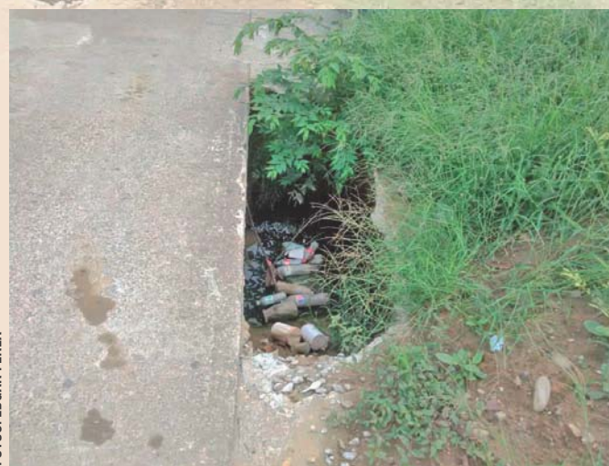
► Poco a poco se agrandan por la ruptura de las lozas.