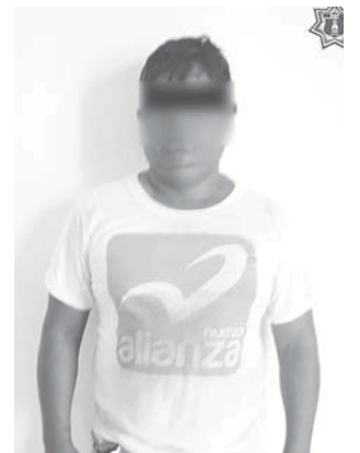
► El hombre quedó arrestado.

Fue así como fue detenido para ser trasladado y puesto a disposición de la Procuraduría General de la